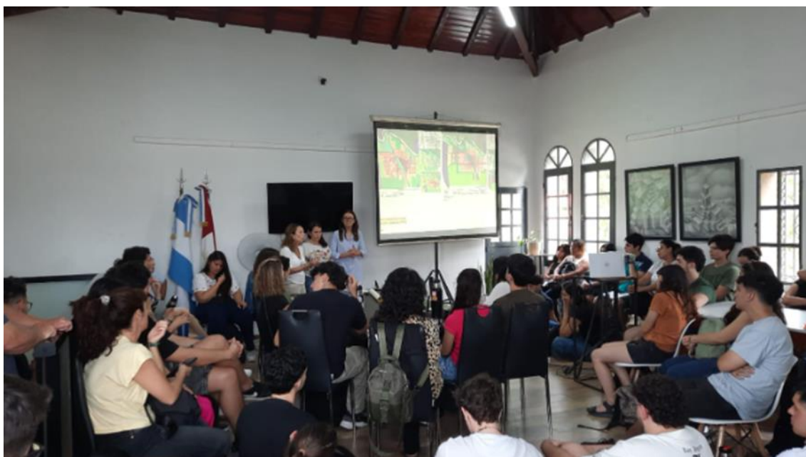
Figura 2 y 3. Tarea en las mesas de trabajo