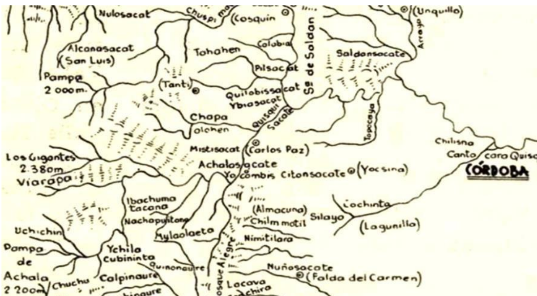
Figura 1. Valle de Punilla antes del Embalse San Roque.

Esos primeros habitantes vivían agrupados en “casas” de hasta 40 familias, distantes pero cercanos y estaban en contacto con los Huarpes, con quienes se identificaban físicamente, con los Sanavirones de quienes adoptaron palabras tales como “sacate” y “charaba” y, durante el siglo XV, recibieron la influencia del Inka. Es decir: se complementaban a escala regional. En 1573, Jerónimo Luis de Cabrera, fundador de Córdoba, encomienda los indios del valle Camín-Cosquín y otorga una merced de tierra de una legua, en la confluencia de los ríos Cosquín y San Antonio, surcada por ríos y arroyos que equivalía a 7.500 has; superficie similar a la actual jurisdicción de VCPaz. La merced como unidad productiva y la mita como estructura social hicieron el resto. Resulta interesante analizar cómo, la mita, que era un sistema de contribución comunitaria de los pueblos andinos precolombinos, fue transformada en esclavitud.