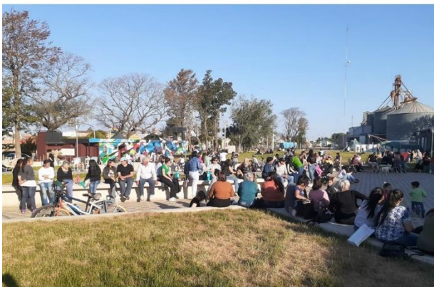
Figura N°10. Espacio de encuentro en Parque Central de Laguna Larga

municipal, provincial y nacional, acompañado de organismos internacionales como la Organización de las Naciones Unidas genera las condiciones adecuadas, para poner en valor los espacios públicos que son