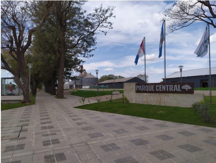
Figura N°5. Ingreso Parque Central de Laguna Larga.

También se tuvo en cuenta la vegetación existente y a cada ejemplar se lo releva y de acuerdo al estado del mismo se lo poda o extrae según sea necesario para conservar la mayor cantidad de vegetación existente, premisa que se tuvo en cuenta a la hora de diseñar el paseo lineal y generar espacios de calidad y confort a cada usuario, como así la incorporación de nueva vegetación de acuerdo a la calidad espacial proyectada.