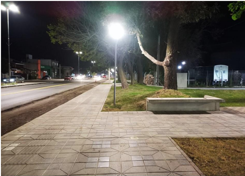
Figura N°6. Sector de Paseo Lineal Raúl Ricardo Alfonsín

Esta nueva propuesta de esparcimiento y espacio de calidad para todos los vecinos permite recuperar el predio ferroviario -donde estaba situada la abandonada Ex Cooperativa Agrícola, reforestar. y hacer una plaza pública o punto de encuentro y unión entre vecinos, desarrollar un espacio de actividades sociales, culturales, deportivas y recreativas, y también revalorizar el paseo "Raúl Ricardo Alfonsín" - donde antiguamente cientos de vecinos caminaban, hacían actividades físicas y disfrutaban su arbolado-.