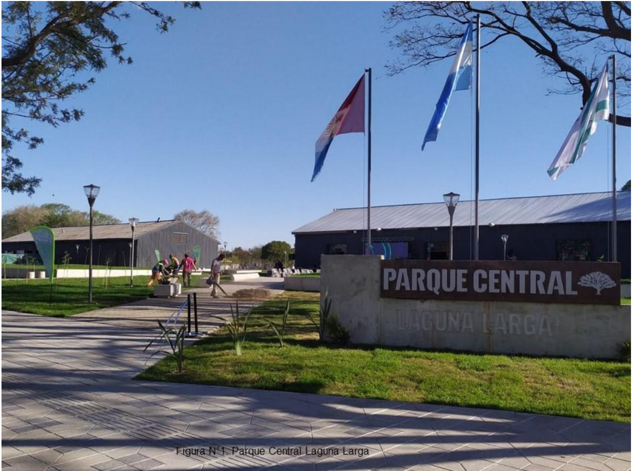
Figura N°1. Parque Central Laguna Larga