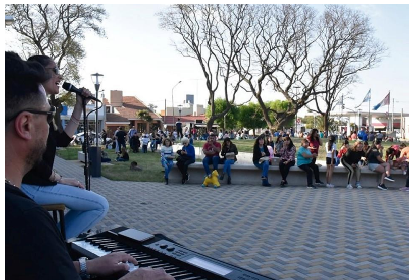
Figura N°7. Explanada Parque Central de Laguna Larga

El impacto de la obra se estimó para una población de 200.000 habitantes, siendo ésta el resultado de un 100% aproximado de población del Departamento