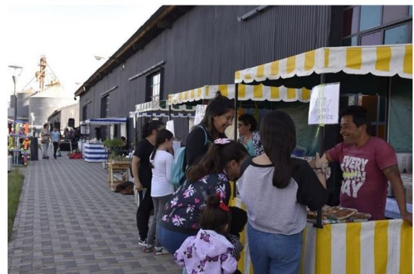
Figura N°9. Feria Parque Central Laguna Larga