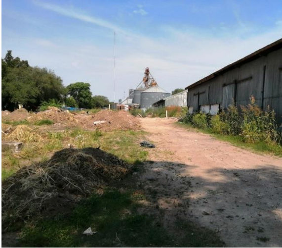
Figura N°2. Sector de futuro Parque Central