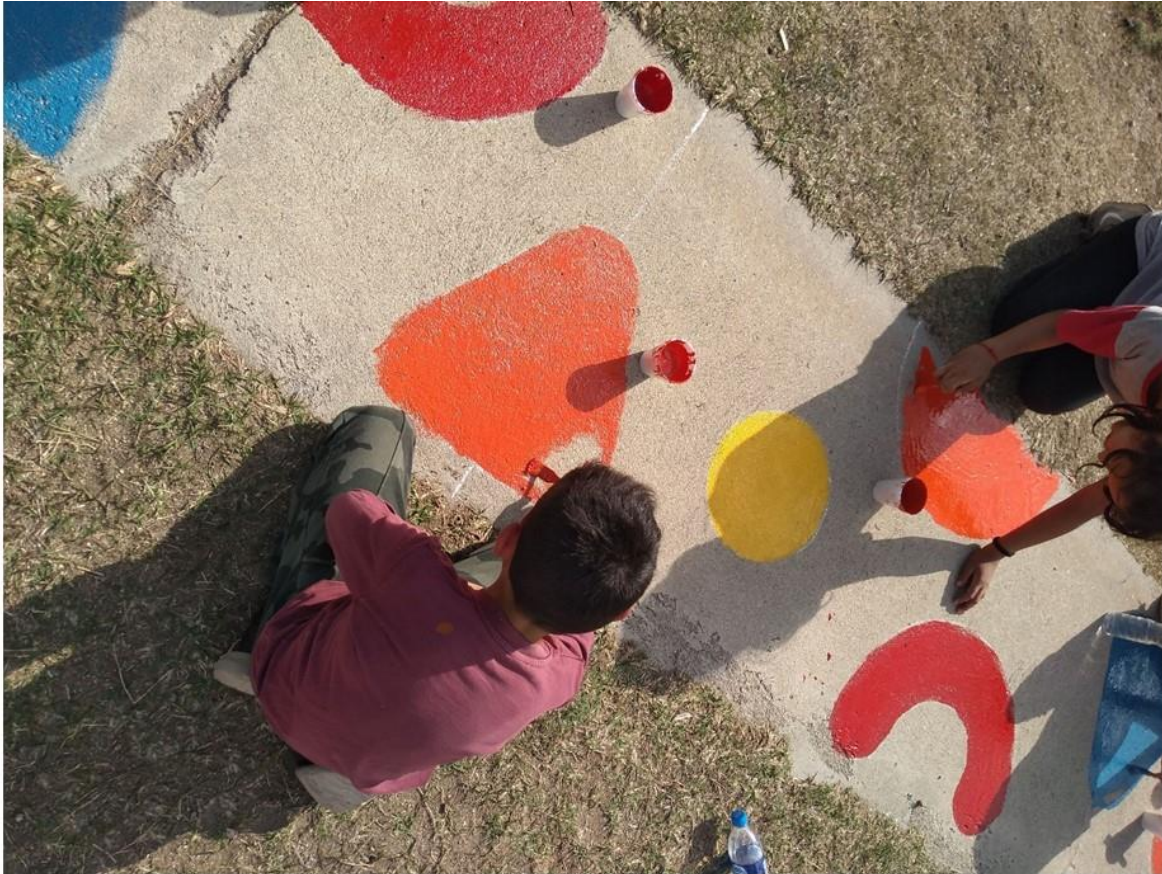
Figura 2. Trabajo participativo con niños y niñas.

partir de estas actividades fue tomado posteriormente como insumos de diseño al momento de proyectar.