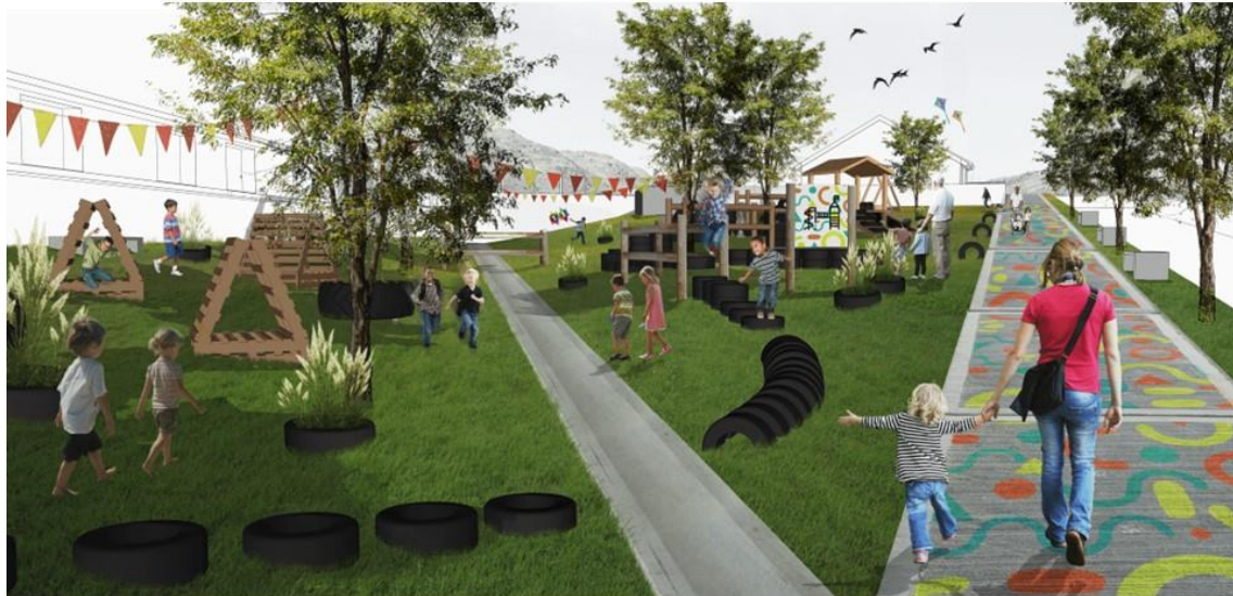
Figura 5. Ideas para el espacio libre de la escuela.

que culmine a finales de diciembre. Aun así, resulta conveniente realizar una evaluación parcial de la experiencia.