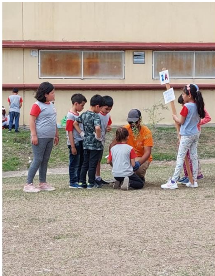
Figura 3. Forestación con niños y niñas VCP.

Como resultado del diagnóstico barrial y respondiendo al enfoque de urbanismo táctico, se definió como lugar de intervención un espacio verde en desuso ubicado en el borde lateral de la escuela primaria, sobre una calle secundaria. El sitio, a pesar de presentar una topografía irregular, contaba con dos potencialidades: por un lado, la ubicación céntrica dentro del barrio, lo cual