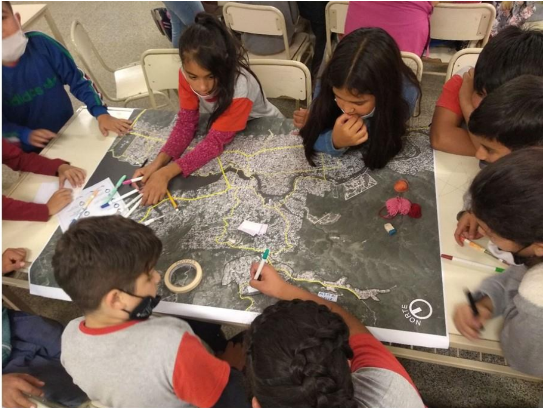
Figura 1. Trabajo participativo con niños y niñas.

localización sobre una arteria principal. vínculos entre los distintos actores sociales. mapeos colectivos, lluvias de ideas, dibujos y collages, se