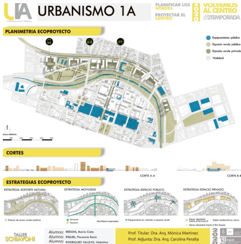
Figura 4. Síntesis contenidos plan maestro y ecoproyecto urbano.