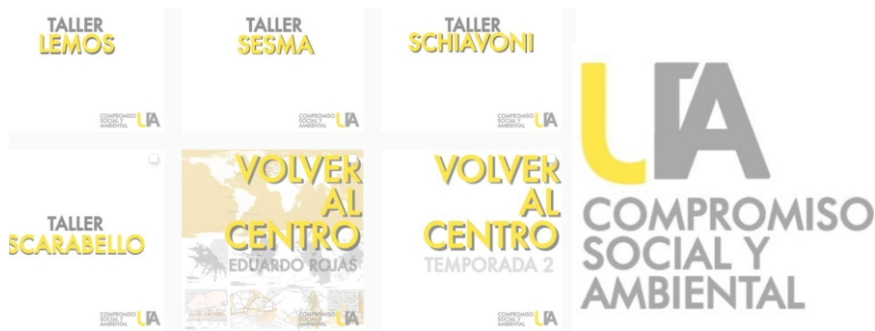
Figura 5. Material producido para Redes Sociales. Elaboración propia

Los alumnos valoraron la dedicación de la cátedra puesta en la modalidad virtual de cursado, para que las actividades se desarrollarán de la mejor manera posible. Algunos comentarios de los estudiantes fueron: