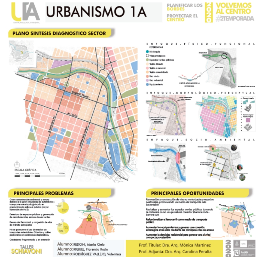
Figura 4. Síntesis contenidos Diagnóstico