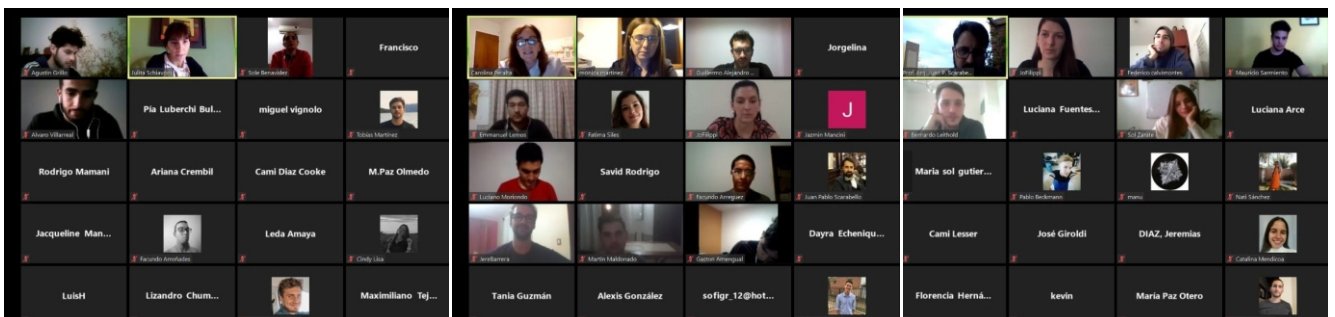
Figura 3. Clases virtuales por plataforma digital ZOOM.

“ La selección del sector respondió al conocimiento previo que los alumnos tienen de la ciudad que habitan o donde estudian, y a la disponibilidad de abundante documentación.”