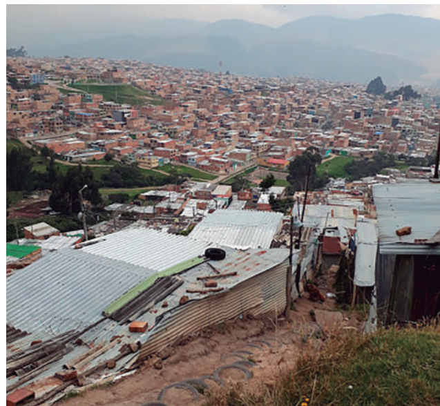
Figura 4. "calle – escalera" Barrio Tocaimita – UPZ Gran Yomasa – Localidad Usme. Fuente: Fotografía del Autor. (2017)

3 y 4), conformados por habitantes desplazados de varias partes del país. Su realidad de zona periférica determina una serie de carencias, desde la legalización de la tenencia de la tierra hasta la precariedad de las viviendas que se construyen y habitan.