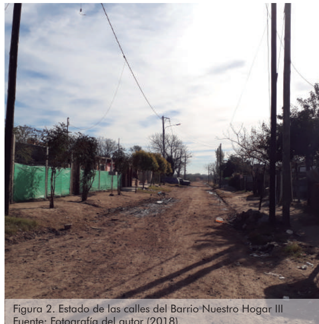
Figura 2. Estado de las calles del Barrio Nuestro Hogar III

la investigación: Estudio Comparativo de instrumentos de Gestión para el desarrollo del borde urbano. Caso de estudio Borde sur oriental de Bogotá, financiada por la Universidad Católica de Colombia, entidad que apoyó la estancia de investigación durante la cual se elaboró el estudio.