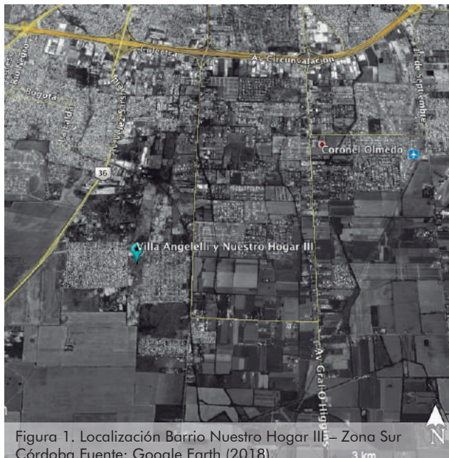
Figura 1. Localización Barrio Nuestro Hogar III – Zona Sur Córdoba.