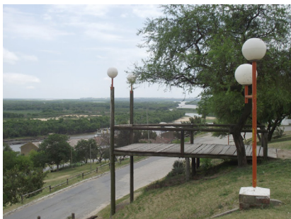
Imagen 7

Coexistencia de comunidades locales sobre un territorio compartido