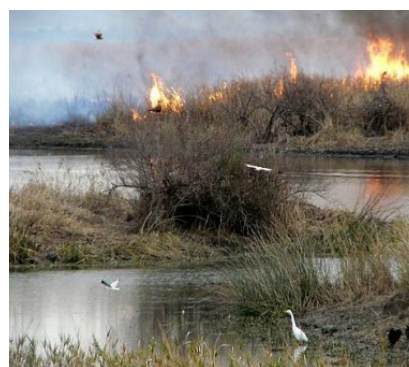
Imagen 2

estructurante de identidad. Se encuentra entre dos Provincias: Santa Fe y Entre Ríos, contando con dos centros urbanos litoraleños: Coronda (Santa Fe) y Diamante (Entre Ríos), distantes 30 km entre sí. El humedal y las islas que lo conforman, planicie inundable con bañados, islas, riachos, arroyos, laguna Coronda, río Coronda y río Paraná, cuyos bordes formados por albardones y barrancas de gran altura lo separan de los territorios de llanura, con una gran riqueza ambiental, paisajística y cultural, se encuentran en permanente cambio natural, definiendo un ecosistema delicado y uno de los