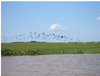
Imagen 6