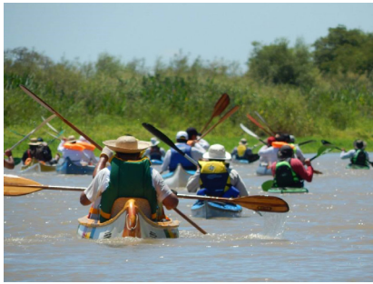
Imagen 4