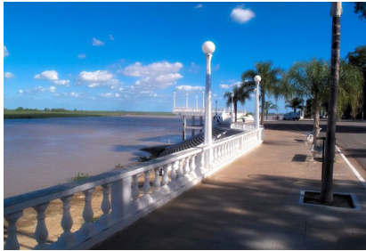
Imagen 5