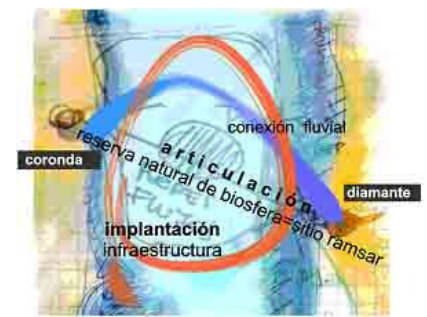
Imagen 8

-Promover la concientización de la comunidad hacia el uso racional de los recursos naturales.