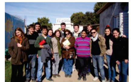
Equipo de Extension

El desarrollo de estas acciones y su continuidad en el tiempo, con la presencia institucional de la Facultad de Arquitectura de la Universidad Nacional de Córdoba, en los barrios vulnerables de la ciudad, las pequeñas mejoras logradas en las condiciones del hábitat y el compromiso con esta parte de la sociedad, se traducen en motivación suficiente para continuar con experiencias equivalentes.