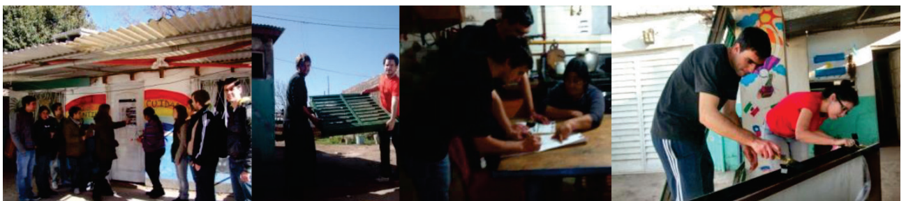
Fig. 2 Comedor Esperanza- B° Guiñazú – Actividad Comunitaria- Transferencia.