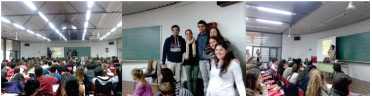
Fig. 1 Clase conjunta Nutrición- Arquitectura- aulas b- UNC- Compartimos experiencias