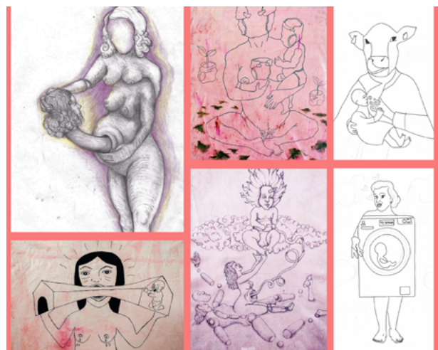
Imagen 5: Aichino, V. y Rozzio, S. M. (2020). Trapitos al sol [instalación]. Ilustraciones.