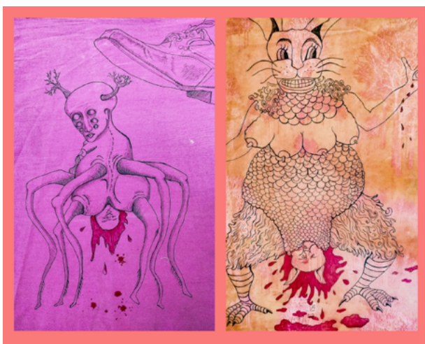
Imagen 4: Aichino, V. y Rozzio, S. M. (2020). Trapitos al sol [instalación]. Ilustraciones.