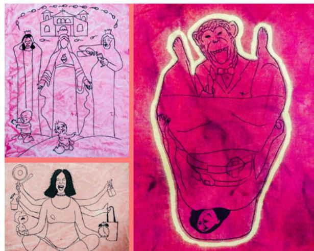
Imagen 3: Aichino, V. y Rozzio, S. M. (2020). Trapitos al sol [instalación]. Ilustraciones.