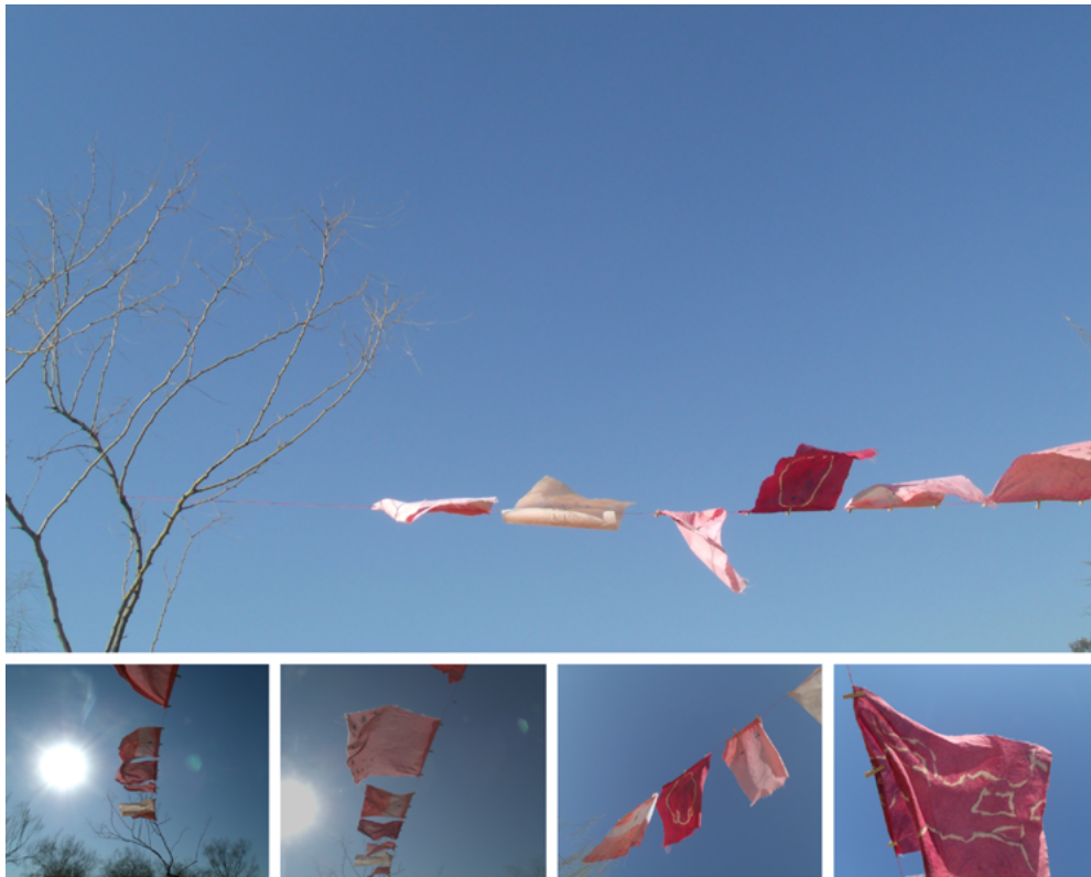
Imagen 11: Aichino, V. y Rozzio, S. M. (2020). Trapitos al sol [instalación]. El viento, el cielo y los trapitos al sol.