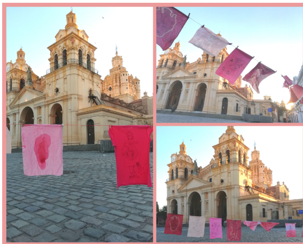
Imagen 8: Aichino, V. y Rozzio, S. M. (2020). Trapitos al sol [instalación]. Emplazamiento Cabildo.