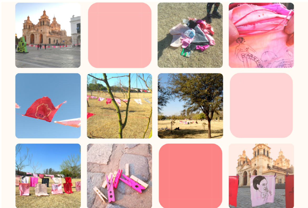
Imagen 10: Aichino, V. y Rozzio, S. M. (2020). Trapitos al sol [instalación]. Materiales de la obra.