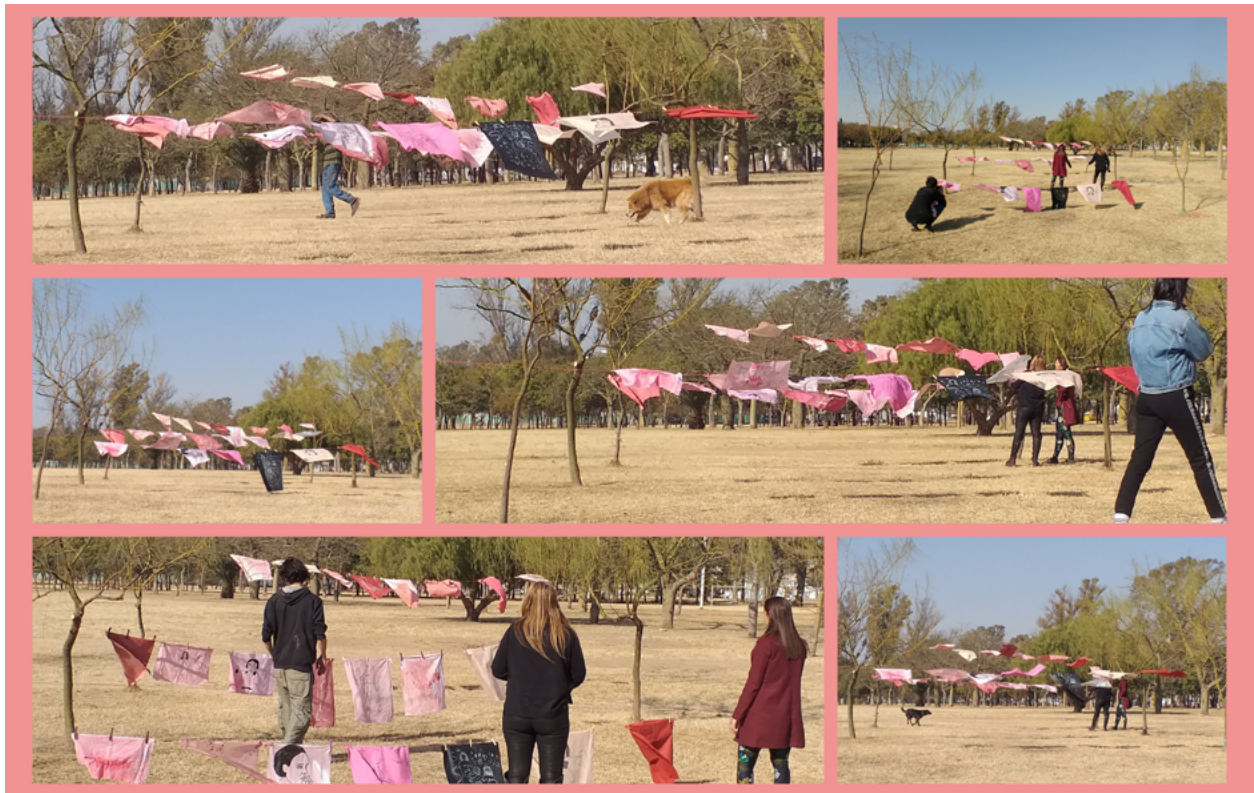
Imagen 7: Aichino, V. y Rozzio, S. M. (2020). Trapitos al sol [instalación]. Emplazamiento Ciudad Universitaria.