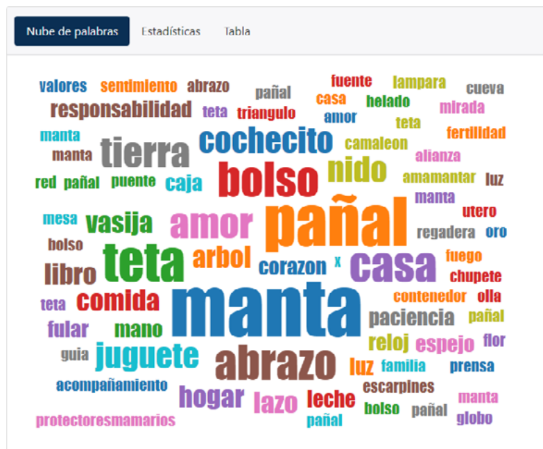
Imagen 1: Aichino, V. y Rozzio, S. M. (2020). Trapitos al sol [instalación]. Palabras más usadas en las respuestas a la pregunta ¿Qué objeto representativo podrías relacionar a la maternidad? (Nube de palabras, 2020).