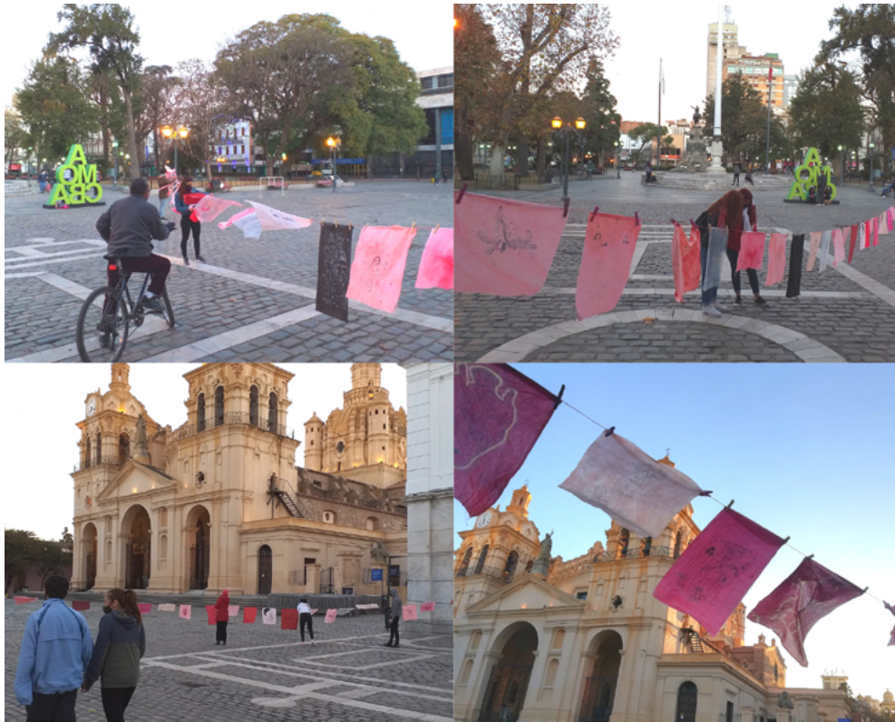
Imagen 9: Aichino, V. y Rozzio, S. M. (2020). Trapitos al sol [instalación]. Emplazamiento Ciudad Universitaria.