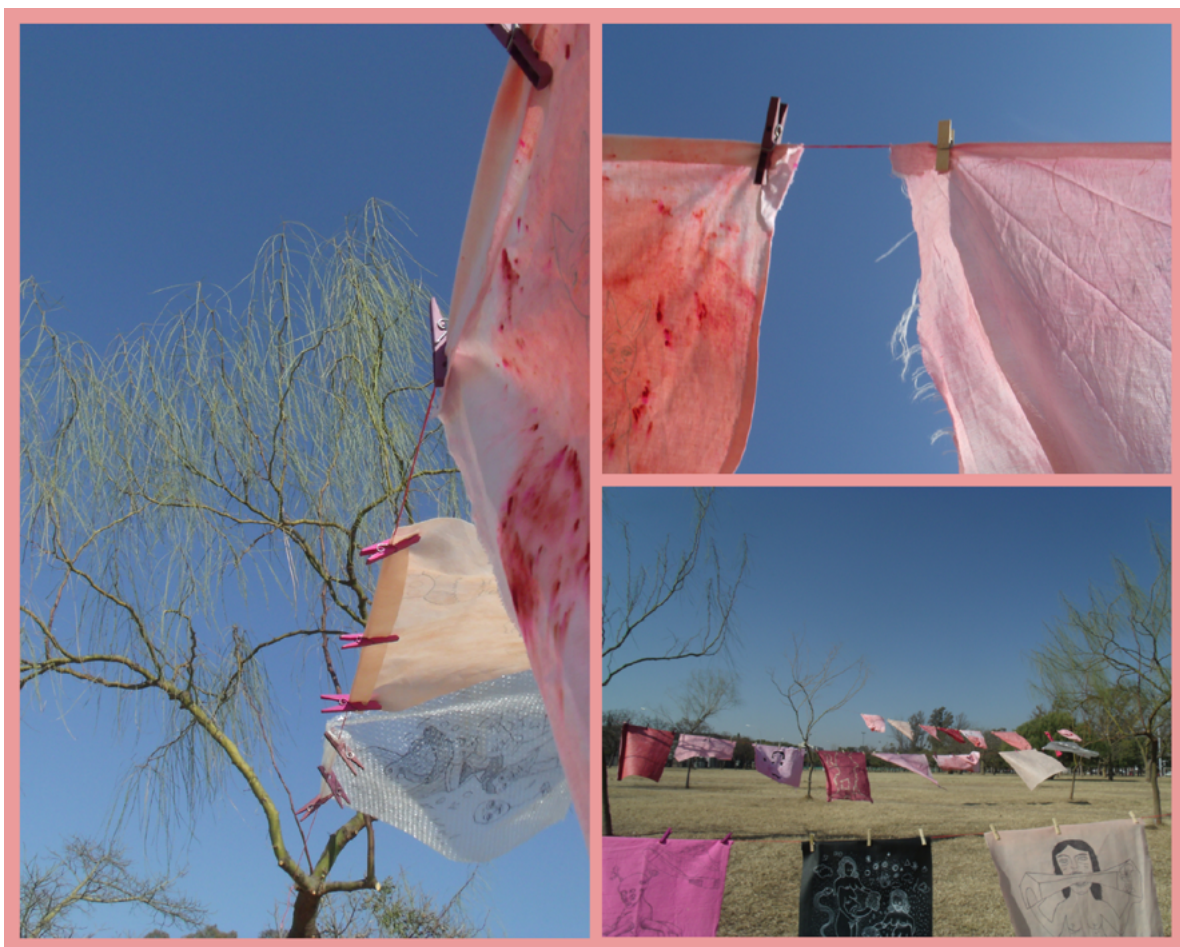
Imagen 6: Aichino, V. y Rozzio, S. M. (2020). Trapitos al sol [instalación]. Emplazamiento Ciudad Universitaria.

Buscamos mantener al público en motivo de la experiencia artística no solo haciéndolo parte del espacio mediante los registros, sino introduciéndolo al proceso de producción representativa. Que la instalación haya sido una obra donde hay circulación permitió que el público experimente diversas percepciones en torno a ella. De acuerdo al análisis de las reflexiones de Merleu-Ponty (1993) –y teniendo en cuenta que se experimenta perceptivamente el mundo y, por lo tanto, el acto de percibir está ajustado a la forma del estímulo–, surgió la intención de colocar las sogas en diferentes alturas con el propósito de que, en el acto de percibir, se modifiquen las perspectivas y generen puntos de vista cambiantes (profundidad, grosor, textura, etc.). Esta decisión compositiva de colocar las sogas a diferentes alturas hace que las imágenes representadas en cada retazo de tela se perciban fragmentadas, lo cual se asocia a la idea de que debajo de los estereotipos de maternidad se esconde el núcleo del conflicto y la superposición de los intereses que subyacen a la problemática planteada.