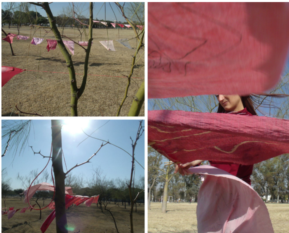
Imagen 12: Aichino, V. y Rozzio, S. M. (2020). Trapitos al sol [instalación]. Los árboles, las conciencias y los trapitos al sol.