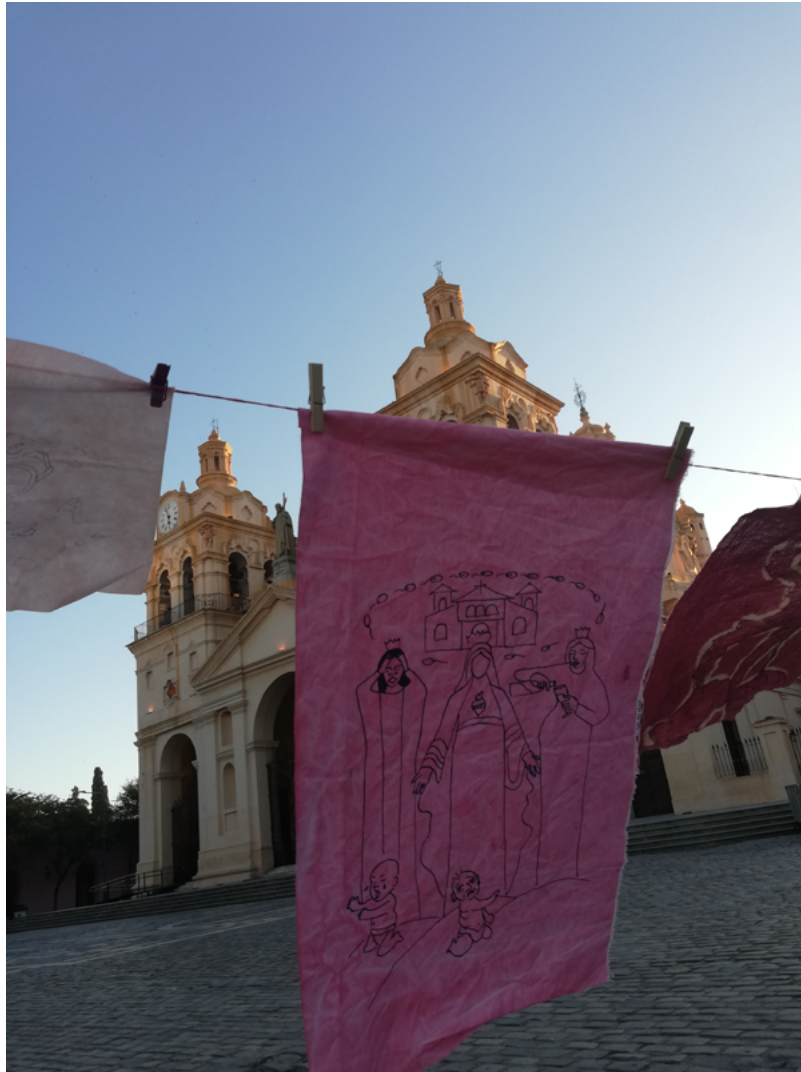
Imagen 13: Aichino, V. y Rozzio, S. M. (2020). Trapitos al sol [instalación]. Resignificación del signo icónico desmontando la idealización y el sentido común.

En la sección sobre la composición de la producción artística hacemos un análisis del contexto a partir de la interpretación de los resultados de la encuesta que terminaron de formar la obra. En el apartado de las categorías estético-formales, analizamos las ilustraciones producidas, repasamos brevemente el espacio de la instalación, pusimos de manifiesto los emplazamientos utilizados en la obra derivada y categorizamos los materiales empleados. Finalmente, en la sistematización abordamos los registros y la exploración de los montajes de la obra, enlazando las experiencias con los conceptos que desarrollamos.