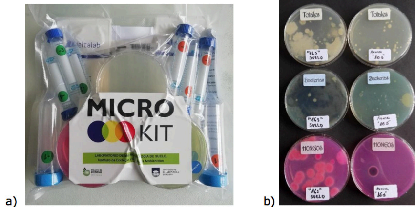
Figura 2: a) Presentación de los componentes del MicroKit® envasados al vacío. b) Foto de placas sembradas por un grupo de docentes durante el taller “Desarrollo de MicroKits para laboratorios prácticos de Microbiología”, luego de una incubación a temperatura ambiente durante 48 h. se observa el crecimiento de colonias de bacterias, hongos filamentosos y levaduras sobre los medios de cultivo.