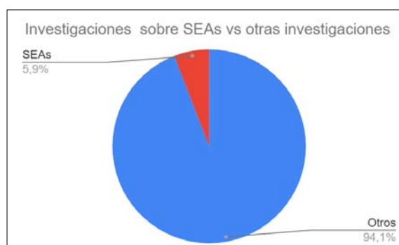
FIGURA 2. Proporción de investigaciones de SEA sobre el total de publicaciones analizadas.

La figura 2, muestra que de la totalidad de los artículos analizados, solo el 6 % de ellos corresponde a propuestas involucradas con una SEA. Recordamos que la intención de esta investigación es reconocer actividades de investigación como potenciales trabajos que podrían ser reimplementados utilizando IBD y de esta forma renovar el espíritu de mejora educativa con la posibilidad realizar aportes teóricos.