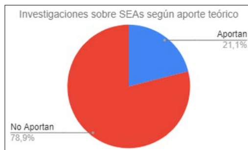
FIGURA 5. Proporción de SEA que aportan y que no aportan teoría sobre el total de publicaciones seleccionadas.

También se analizan los niveles de asociación entre los marcos teóricos presentados en los trabajos seleccionados con sus respectivos diseños e instrumentos de evaluación. A continuación se exponen los resultados: