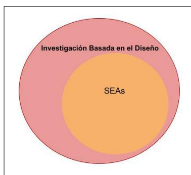
FIGURA 1. Representación de la relación entre IBD y las SEA.

Fundamentalmente, las SEA son un artefacto didáctico diseñado para un contexto particular, mientras que la IBD utiliza el diseño de la SEA, su implementación y su evaluación sucesiva para el desarrollo de modelos sobre cómo piensan los estudiantes, cómo actúan y cómo aprenden. Es decir, un componente fundamental de la IBD es que el diseño se concibe no solo para satisfacer las necesidades locales, sino para generar teoría, para descubrir, explorar y confirmar relaciones teóricas. proporcionar evidencias concretas de mejoras locales como resultado de un diseño particular es condición necesaria aunque no suficiente. La IBD requiere algo más que demostrar que una SEA funciona, sino que exige al investigador ir más allá y generar afirmaciones basadas en pruebas sobre el aprendizaje, que aborden cuestiones teóricas contemporáneas y fomenten el conocimiento teórico del campo. En resumen, las SEA son parte de la IBD por lo que no son conjuntos disjuntos sino que la IBD abarca las SEA pero intenta, a través de sucesivas evaluaciones e iteraciones, sumar aportes humildes a la teoría de base (figura 1).