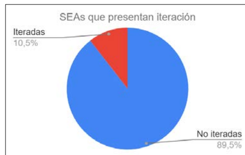
FIGURA 4. Proporción SEA iteradas y no iteradas sobre el total de publicaciones seleccionadas.