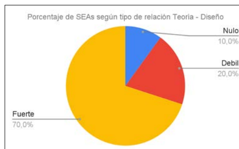
FIGURA 6. Porcentaje SEA según el nivel de relación teoría y diseño.

También se analizan los niveles de asociación entre los marcos teóricos presentados en los trabajos seleccionados con sus respectivos diseños e instrumentos de evaluación. A continuación se exponen los resultados: