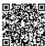
FIGURA 3. Código QR que da acceso a la guía de trabajo.

En la figura 3 se muestra un código QR que permite acceder a la guía de trabajo confeccionada por la profesora: