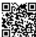
FIGURA 4. Código QR que permite acceder al video.

La figura 4 corresponde al código QR que enlaza a uno de los videos que la profesora usa en sus clases: