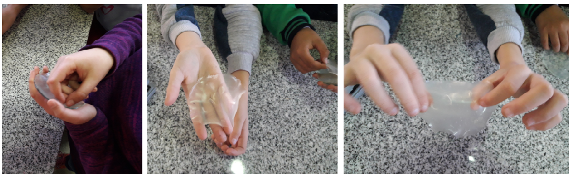
FIGURA 3. Pruebas de elasticidad, permeabilidad y flexibilidad realizadas al biopolímero sintetizado, una vez retirado del vidrio de reloj.

En física el término elasticidad designa la propiedad mecánica de ciertos materiales de sufrir deformaciones reversibles cuando se encuentran sujetos a la acción de fuerzas exteriores y de recuperar la forma original si estas fuerzas exteriores se eliminan. Esto se explica de manera sencilla estirando una bandita elástica y soltándola para que recupere su forma inicial.