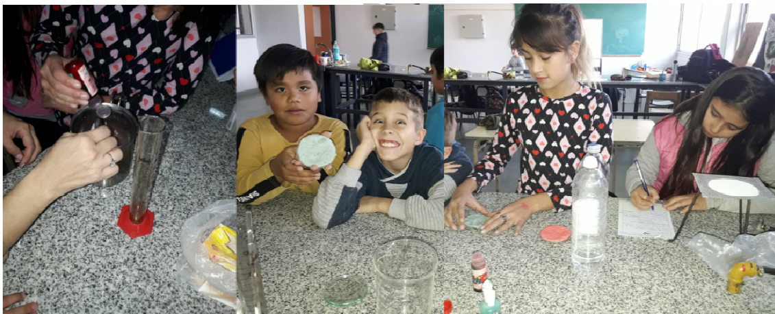
FIGURA 2. Sintetizando el polímero, estirándolo sobre vidrio de reloj y registrando lo realizado

Una vez sintetizado el polímero biodegradable, se estiró sobre un vidrio de reloj y se dejó enfriar para su posterior evaluación (fig. 2).