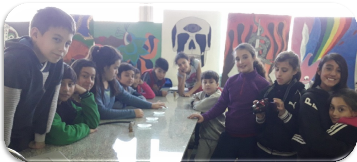
FIGURA 1. Fotografía de los catorce niños de entre 5 y 12 años de edad que participaron de la actividad.

Si bien la problemática a abordar es conocida por toda la ciudadanía, trabajar con catorce niños de entre 5 y 12 años de edad, en un mismo curso, constituyó un verdadero desafío para la docente a cargo.