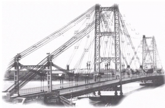
Puente ‘Ingeniero Marcial Candiotti’, el 08 de junio de 1928

Tómese el siguiente caso de la siguiente fotografía del puente colgante ubicado en la ciudad de Santa Fe, acompañada con la leyenda que sirve de identificación: