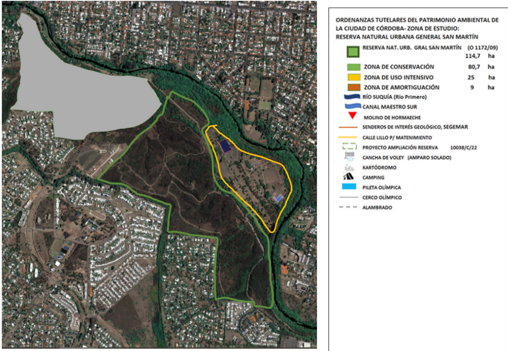
Figura 3. Las ordenanzas, lo provincial y los usos

Elaboración propia en base mapas satelites.pro ( https://satellites.pro/mapa_de_Argentina#-31.356990,-64.275084,15 )