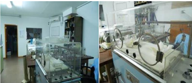
Figura 2. Instrumental del Laboratorio del Ferreyra en 2013.

Para finalizar este análisis, se tuvo en cuenta cómo fue el contexto sociopolítico e institucional en el cual se desarrollaron estas primeras investigaciones. Luego del golpe de estado de 1966, se desmantelan los planteles docentes y se genera un debate conceptual en torno a la figura del profesional psicólogo (Rossi, et al, 2001). Se pueden ver consecuencias de lo sucedido en el país en esta época, ya que en el relevamiento realizado se observó una disminución en el volumen de las publicaciones de este instituto. En efecto, se encontraron dos publicaciones, una en 1960 y otra en 1969, lo cual haría pensar en una posible incidencia de estos acontecimientos en el desarrollo de sus actividades, durante este periodo. En 1976 la intervención del gobierno militar supuso el desmantelamiento de