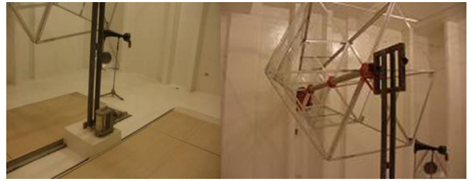
Figura 4. Vista interna e instrumental de la cámara de reverberación.