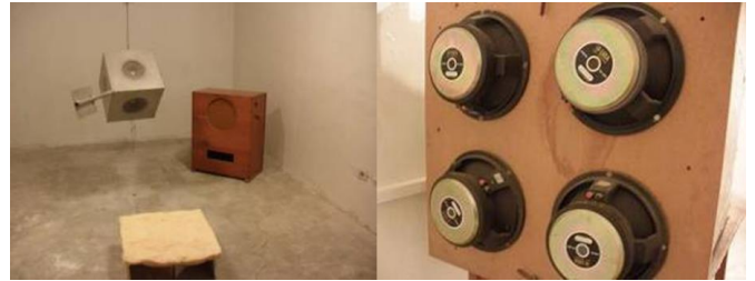
Figura 5. Vista de la Cámara de Transmisión y Recepción del CIAL.