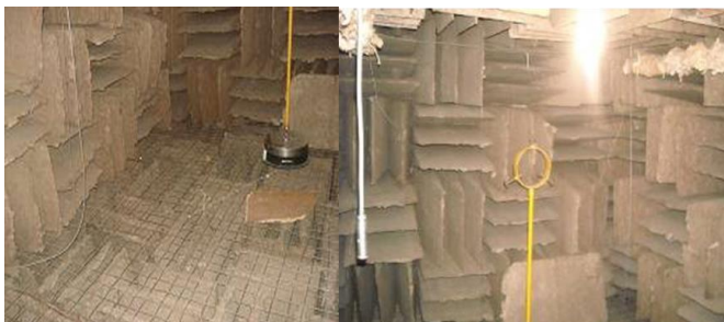
Figura 3. Vista del interior de la Cámara Anecoica.