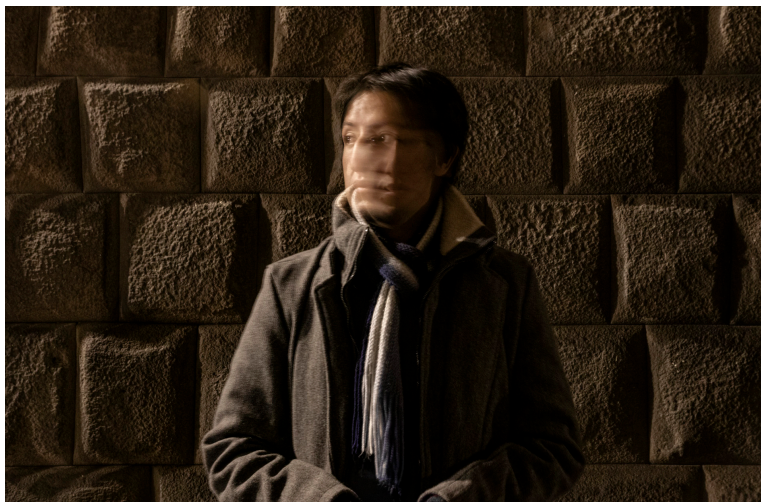
Cusco, Perú, 1991 Fotógrafo, diseñador y animador stop motion

Estudió la carrera de Ciencias de la Comunicación en la Universidad Nacional del Centro del Perú (UNCP). En el ámbito fotográfico ha realizado registros documentales de diversas expresiones culturales en las regiones de Junín, Ayacucho, Huancavelica, Apurímac y Cusco.