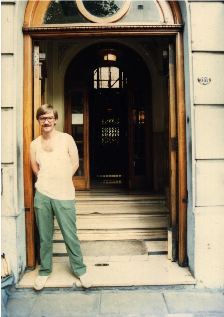
Sede de la CHA calle Rodríguez Peña 681.