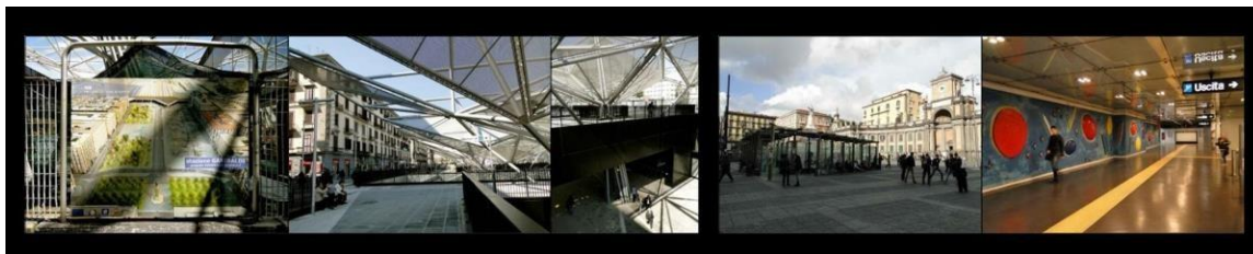
Figura 6. Intervenciones de las Estaciones Garibaldi y Dante.

Dentro de las estaciones que aún se encuentran en construcción o que han sido abiertas parcialmente, se encuentran: