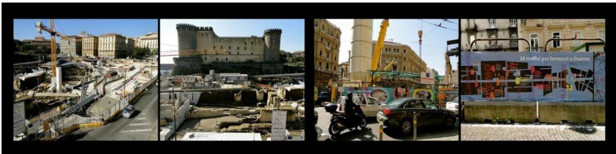
Figura 7. Intervenciones de las Estaciones Municipio y Duomo.

La estación propone un equilibrio entre lo moderno y lo antiguo, destacando los restos arqueológicos del antiguo gimnasio de la época de Augusto.