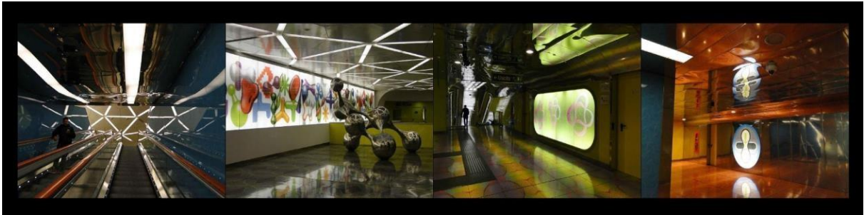
Figura 5. Intervención de la Estación Università.