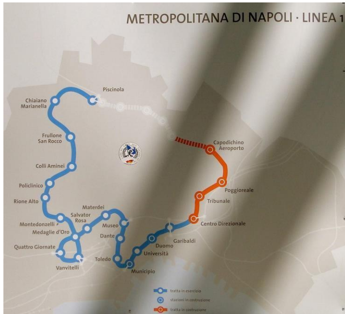
Figura 3. Las estaciones de la línea 1 de la red metropolitana de subte.

Eje del transporte público en el área urbana de Nápoles, la línea 1 (Ver Figura 3).es la única línea ferroviaria que posee las características propias de una metropolitana. A lo largo de su trayecto, sirve a 17 estaciones, de las cuales destacan tanto por sus hallazgos arqueológicos como por las propuestas de intervención, las estaciones Garibaldi, Università, Municipio, Toledo, Duomo y Dante.