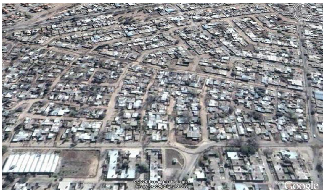
Fig. 3b: Vista aérea parte del asentamiento General Savio. Año 2008.