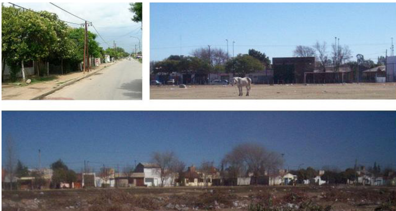
Fig. 2: Vistas del entorno del Asentamiento General Savio.