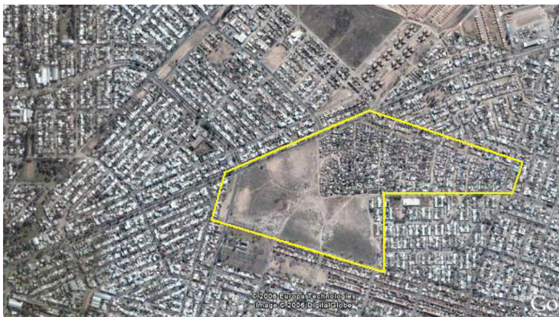
Fig. 3a: Vista aérea del sector Google Earth. Año 2008.

La zona de intervención cuenta con 883 6 familias, lo cual representa aproximadamente 3.121 habitantes. En relación al número de integrantes por familia, encontramos que el 70% de las unidades domésticas (552 unidades domésticas) están conformadas por 2 a 5 personas, mientras que 150 unidades domésticas, es decir el 19% esta conformadas por un número de integrantes que varía de 6 a 8. En cuanto a los hogares unipersonales encontramos un 8.7% (69 hogares) mientras que el 2.3% del total de la población restante, son familias numerosas, es decir, de 8 o más miembros.