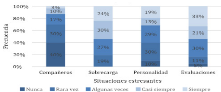
Gráfico 1. Reacciones físicas experimentadas por estudiantes de segundo año que transitaron evaluación por ECOE en la Licenciatura de Enfermería de la UNNE durante el 2023 (n=65).

Con respecto a las situaciones estresantes, un 54% de los estudiantes se refirió a la sobrecarga de tareas y las evaluaciones de los profesores , seguido por un 38% a la participación en clases , 32% hicieron referencia a la personalidad y el carácter del profesor , así como también a no entender los temas que se abordan en la clase y en menor frecuencia, a la competencia con los compañeros del grupo (13%). (Ver gráfico 1).