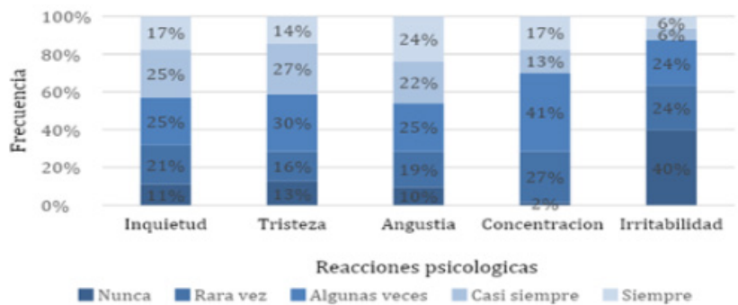
Gráfico 3. Reacciones psicológicas experimentadas por estudiantes de segundo año que transitaron evaluación por ECOE en la Licenciatura en Enfermería UNNE, durante el 2023 (n=65).

Sobre las reacciones psicológicas, los estudiantes identificaron en un 46% sentimientos de angustia, ansiedad o desesperación ; así como también inquietud (42%), sentimientos de depresión o tristeza (41%), y en menor frecuencia dificultad en la concentración (30%) e irritabilidad (12%). (Ver gráfico 3).