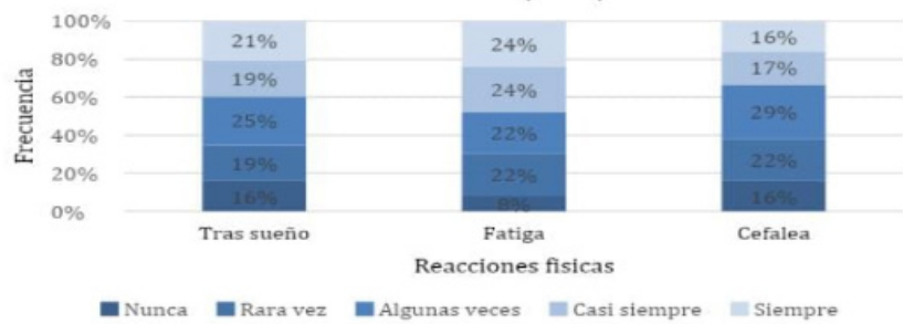
Gráfico 2. Reacciones físicas experimentadas por estudiantes de segundo año que transitaron evaluación por ECOE en la Licenciatura en Enfermería UNNE, durante el 2023 (n=65).

Sobre las reacciones psicológicas, los estudiantes identificaron en un 46% sentimientos de angustia, ansiedad o desesperación ; así como también inquietud (42%), sentimientos de depresión o tristeza (41%), y en menor frecuencia dificultad en la concentración (30%) e irritabilidad (12%). (Ver gráfico 3).