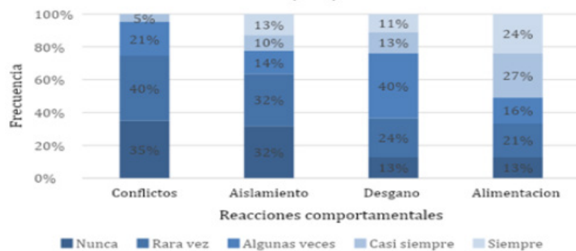
Gráfico 4. Reacciones comportamentales experimentadas por estudiantes de segundo año que transitaron evaluación por ECOE en la Licenciatura en Enfermería UNNE, durante el 2023 (n=65).

Teniendo en cuenta la variable de reacciones comportamentales, los estudiantes exteriorizan con mayor frecuencia problemas en la alimentación relacionados con el aumento o la disminución en el consumo de alimentos habituales (51%), y en menor proporción sensación de desgano para realizar las labores escolares (24%), aislamiento de los demás (23%) y conflictos o tendencia a polemizar o discutir (5%). (Ver gráfico 4).