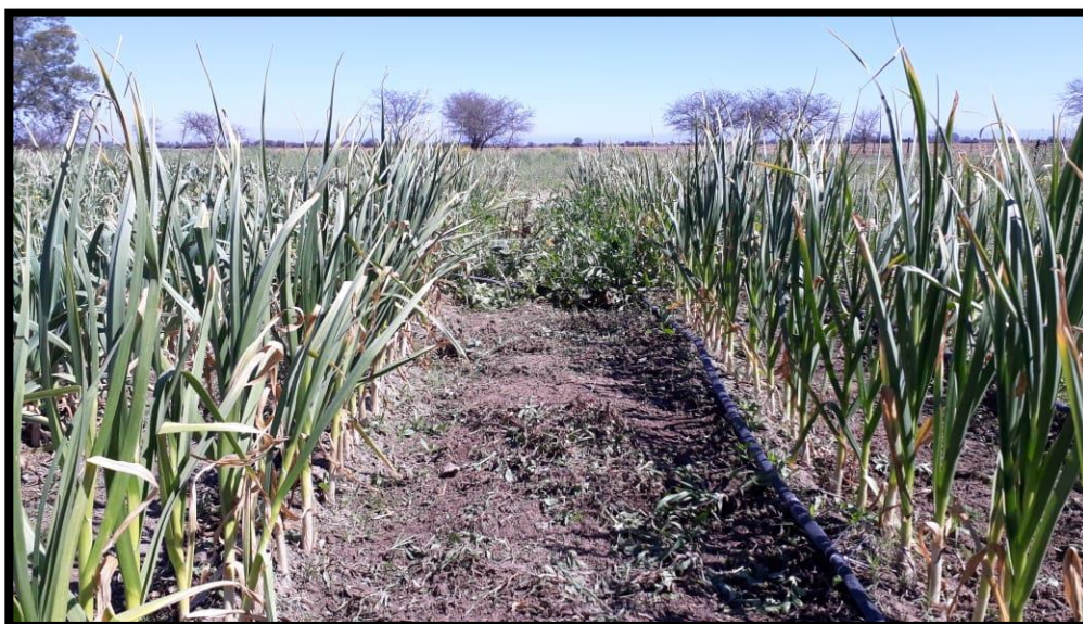
Figura 2: Estado de la parcela testigo cerca del fin de ciclo del cultivo