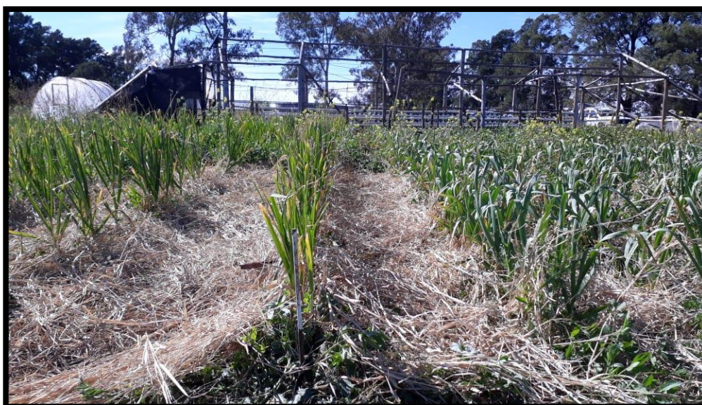
Figura 3: Estado de la parcela con acolchado cerca del fin de ciclo del cultivo.