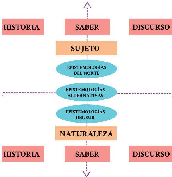
Fig. 1: Distintas nociones que atraviesan a los grandes grupos epistemológicos

Para graficarlo, se ha decidido presentar a un par de las nociones de forma vertical, pues se las considera como parte de un eje desde el cual se dan las principales diferencias entre cada grupo; las otras nociones se presentan de manera horizontal pues, en un primer acercamiento, se comprenden como el piso en común que da lugar al debate de cómo se comprende al conocimiento en general y al conocimiento legítimo (o científico) en particular.