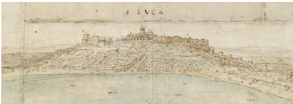
Fig. 2. Pluma y tinta del holandés Anton van den Wyngaerde (c.1525-1571). Vista panorámica de la ensenada de Sanlúcar de Barrameda 1567 (Ashmolean Museum, University of Oxford).