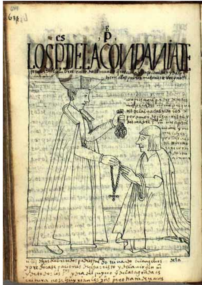
Fig. 4. Guaman Poma Dibujo 253. Los padres de la Compañía de Jesús, "santos hombres en todo el mundo, que dan lo que tienen a los pobres de este reino". (Guaman Poma, Nueva corónica y buen gobierno (1615) Biblioteca Real de Dinamarca, Copenhague https://poma.kb.dk/permalink/2006/poma/649/es/image )

apostaba el ejército español: “et fii tanta l'allegrezza di tutta quella, che non si poteva esplicare; venevano tante barche et chanoë, che per doi giorni non potevamo sodisfare al desiderio che tenevano di veder gente et udir nuove di Spagna.” (Egaña, 1954, I, 170). 54