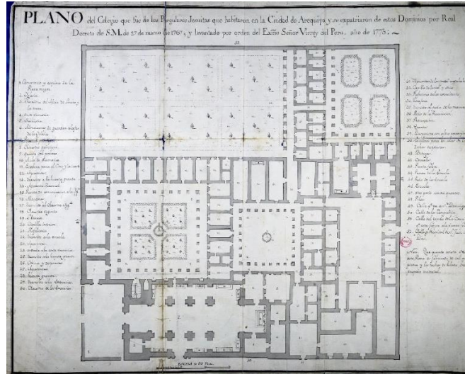
Plano de 1773 del ex colegio jesuita de Arequipa (Perú).