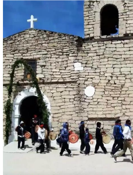
Comienzo de la procesión circular alrededor del templo durante la celebración de Norirawachi (“cuando caminamos en círculo”), conocida también como Semana Santa Rarámuri , en el ejido de San Ignacio de Arareco, Bocoyua, Chihuahua.

En el artículo Un bosquejo de las instituciones jesuitas de las Provincias de Perú y Paracuaria en 1767 , Robert Jackson aporta a través de mapas e información puntual, un panorama muy interesante sobre la presencia jesuita en dos provincias: Perú y Paracuaria hacia el año de 1767, cuando el rey Carlos III ordenó la expulsión de los jesuitas de todo el territorio español.