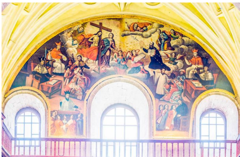
Apoteosis de la Orden Jesuita.