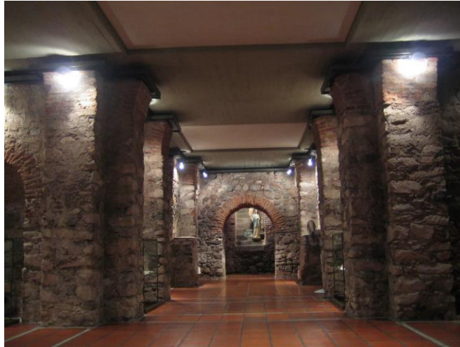
Nave central de la cripta del noviciado jesuítico.

del siglo XVIII. De igual manera, el artículo aporta información interesante acerca de los trabajos y la recuperación arqueológicos de la cripta de la inconclusa iglesia.