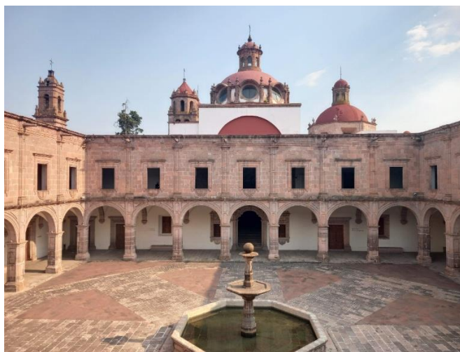
El patio principal del ex colegio jesuita de Valladolid (Morelia, Michoacán).