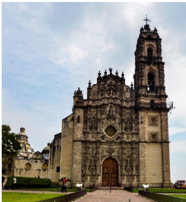
Iglesia jesuítas de San Francisco Javier, Tepotztlán.