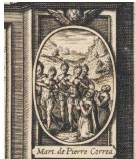
Fig. 2 Detalle del martirio de los HH. Correia y Souza del artista Gaultier (Biblioteca Nacional de Portugal).