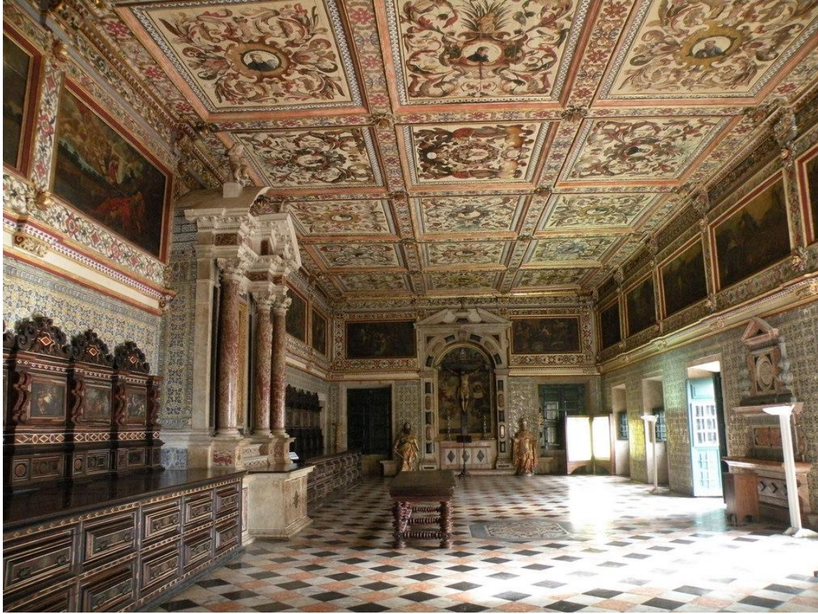
Fig. 4. Vista general sacristía de la Catedral de Bahía.