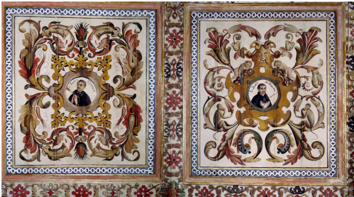
Fig. 5. Detalle de los retratos de Pedro Correia y João de Souza en el techo de la sacristía de la Catedral de Bahía.

ubicados en el extremo sur de la sacristía. Aunque afirma De Moura Sobral (2001, p. 346),