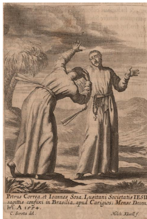
Fig. 3 El martirio en la representación del grabador alemán Melchior Küsel publicado en el libro de Tanner.

Si bien toda la ornamentación de la sacristía está interrelacionada, entre la ubicación de los altares y la disposición de los retratos (Fig. 4), nos referiremos solo a estos últimos, compuestos por sacerdotes y coadjutores jesuitas, algunos canonizados y beatificados hasta el momento de la decoración. Fueron colocados en el casetonado del techo en forma de cruz con San Ignacio en el centro, en medio de floridas tarjas. En los cuatro cuadros restantes se pintaron mártires de la Asistencia de Portugal. Entre ellos Pedro Correia y João de Sousa,