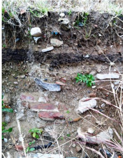
Fig. 3 Superposición de estratos cortado por una creciente: el relleno inferior es moderno de mampostería de cemento y ladrillos, y las capas superiores de tierra negra y escombros son recientes para nivelar el lugar.