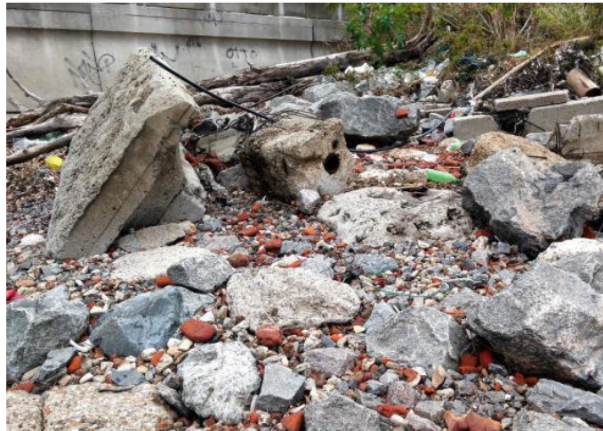
Fig. 4 Contexto del hallazgo: bloques de hormigón y mampostería reciente entre el basalto de protección de la costa, y pequeños ladrillos rodados.