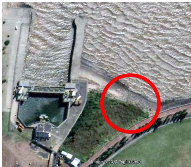
Fig. 2 Único sector de playa en la zona norte de la ciudad, se observa la acumulación de escombros llegados en las bajantes del río. Entre Ciudad Universitaria y el Parque de la Memoria.