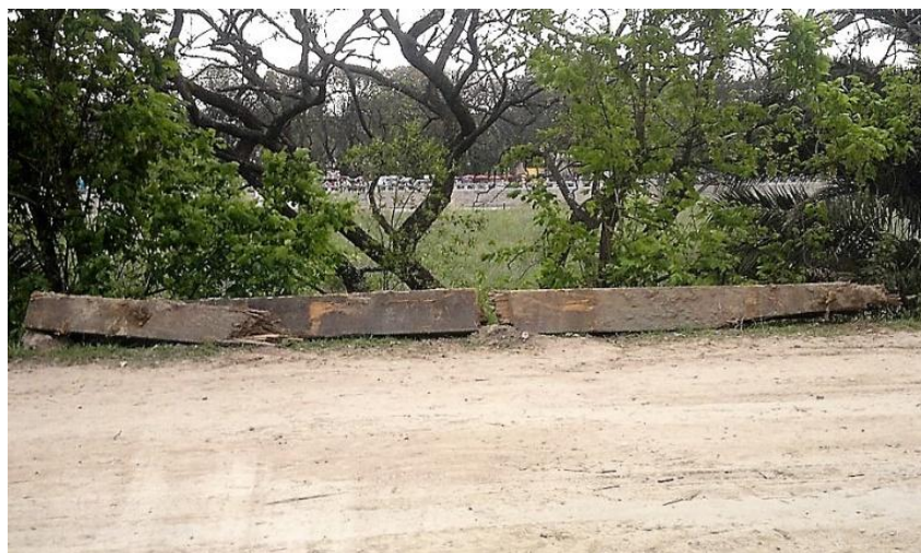
Fig. 10 Pilar de seis metros de altura proveniente de un muelle de la zona de El Tigre, de más de veinte metros de largo, traído por la corriente a la Reserva Ecológica (las roturas fueron hechas para moverlo), en el año 2012.

cia. Y los problemas que hubo hasta que se aprendió a distinguir estas diferencias (Furlong 1946, pp. 231-233).