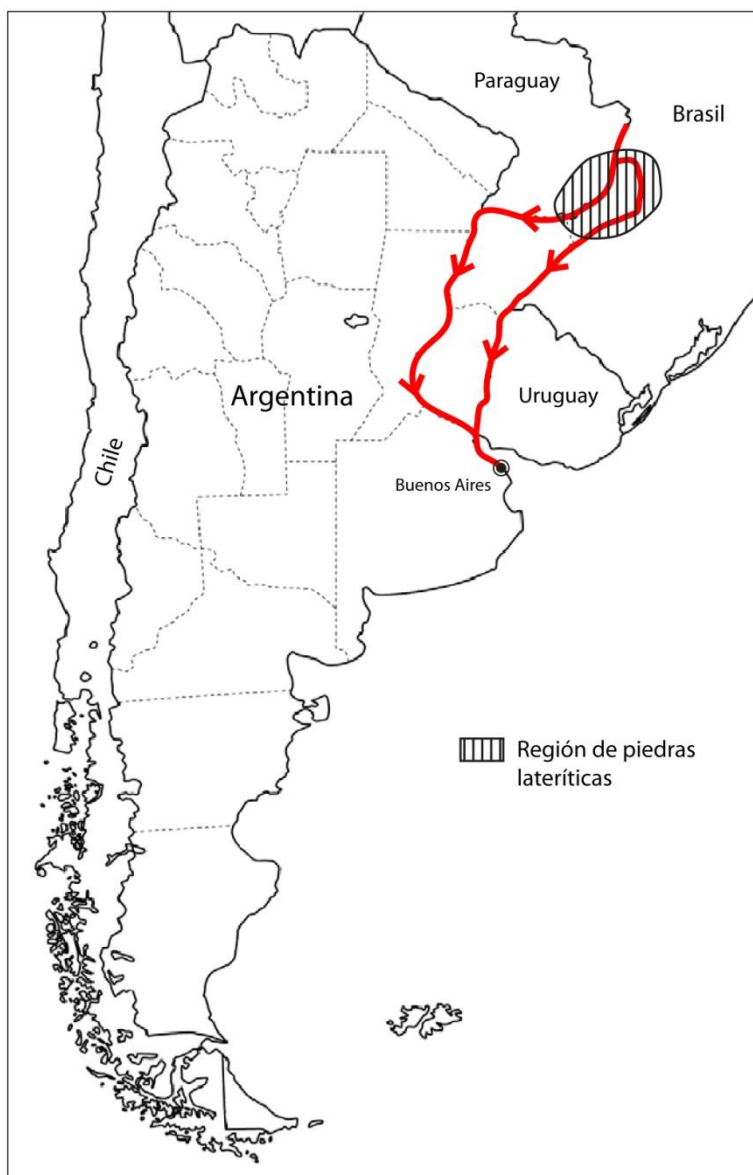
Fig. 1 Mapa del posible desplazamiento de las piedras desde las Misiones hasta Buenos Aires

Estas son las preguntas que surgen de un hallazgo inusual y cuyas respuestas son, al menos por ahora, difíciles de contestar. Pero vale la pena presentar el tema para abrir un diálogo que puede permitir resolver al menos las preguntas en el futuro. A veces la arqueología, al recorrer sectores de la ciudad que parecen marginales o que acumulan basura de una u otra forma, suele arrojar sorpresas. La costa de la ciudad ya ha mostrado ser un acumulador de objetos de todo tipo -hasta flora y fauna incluidas- llegados de largas distancias.