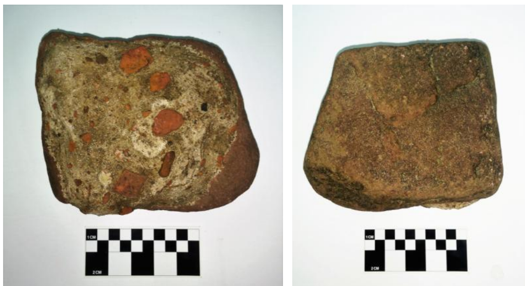
Figs 8 y 9. Fragmento de piedra formateada rectangular con mortero de cal, ladrillo y tejas en una de sus superficies.

La presencia de cal es indicador de su cronología ya que los jesuitas tuvieron graves problemas para usar este aglomerante que según la bibliografía llegó a la región en 1745 (Levinton 2010). Esto puede ser indicador de que es de las últimas construcciones jesuitas, o incluso de época pos-jesuitica, en que continuó la labor constructiva en piedra hasta inicios del siglo XX (Schávelzon 2016, Schávelzon e Igareta 2017).