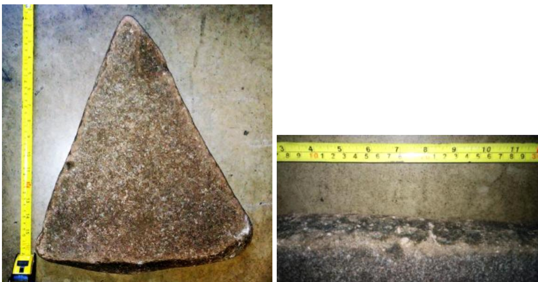
Figs. 5 y 6 Piedra triangular y muestra del tallado por percusión manual en uno de sus bordes.

¿Cuál era su función? Suponemos que la triangular era la base de alguna pila bautismal, fuente o escultura, que por su peso y forma, o cumplía una función arquitectónica o debía estar sobre el piso formando un círculo soportando algo con pequeñas columnitas.