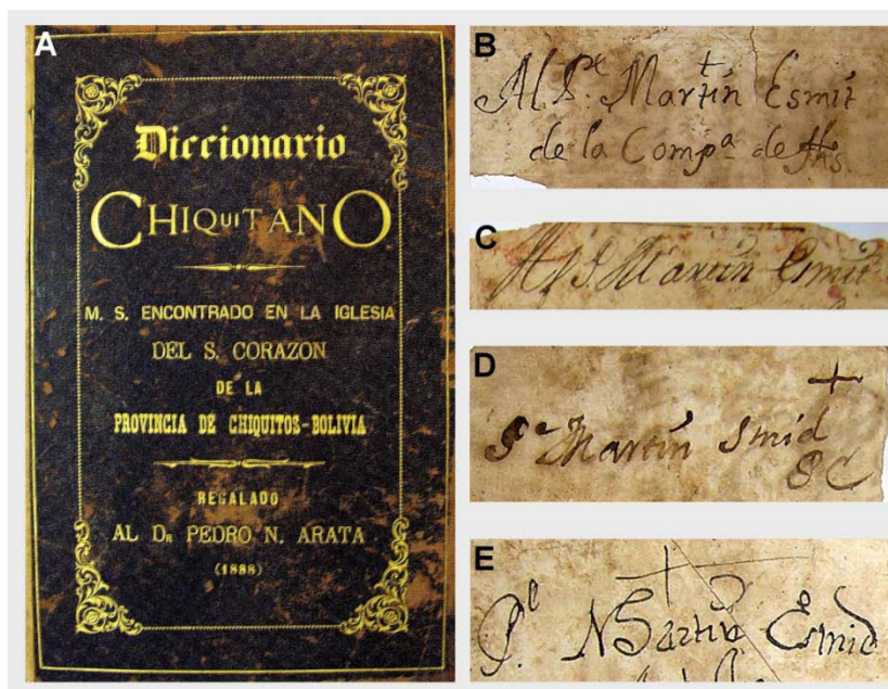
Fig. 1. A, Vocabulario Chiquitano-Español, Biblioteca Arata, MS. Inv. 13.581. Tapa de la reencuadernación en cuero, ca. 1888. B-E, Vocabulario de la lengua chiquita parte 1ª Español-Chiquito , Biblioteca Arata, MS. Inv. 13.580. Detalles de cinco fragmentos de cartas que formaban parte del cartón de la encuadernación original del MS; en todos ellos aparece Martín Schmid como destinatario de cartas redactadas por manos diferentes.

'...Estos fragmentos de cartas han servido para formar el cartón con el que estaba encuadernado este tomo del Diccionario Chiquitano, comprado al Padre De Pedri –de los Misioneros franciscanos del Chaco- por 200$. 1904 [firmado] P.N. Arata...'