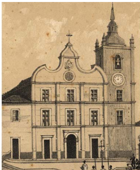
Catedral da Sé – 1856 Litografia

O mesmo não ocorreu com o Palácio Episcopal. Na litografia a fachada encontra-se de acordo com o estilo colonial da igreja, no entanto a fotografia de Gaudêncio relata a descaracterização arquitetônica com ornamentação neoclássica, distanciando radicalmente da característica colonial do templo.