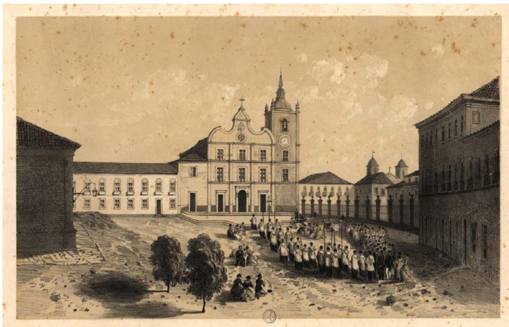
Fig. 1 Catedral de São Luís do Maranhão Litografia de 1856, de Friederich Hagerdorn . Impressa em Paris por Bernard Lemercier. 35

Na procura de imagens antigas da Catedral da Sé e do Palácio Episcopal encontramos registros realizados pelo fotógrafo paraense Gaudêncio Cunha, entre os quais fazem parte do Álbum do Maranhão de 1908 36 .