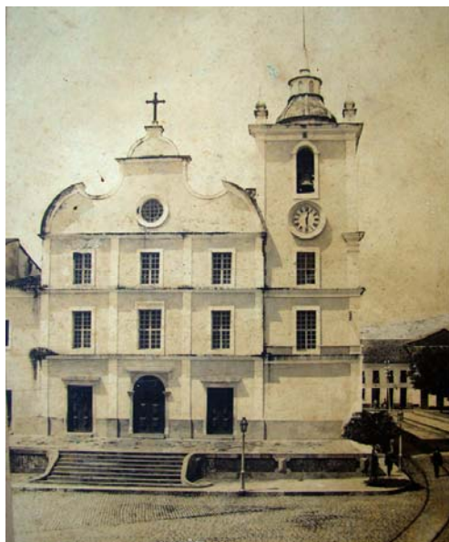
Fig. 2 Catedral da Sé – 1908 Fotografia de Gaudêncio Cunha 38