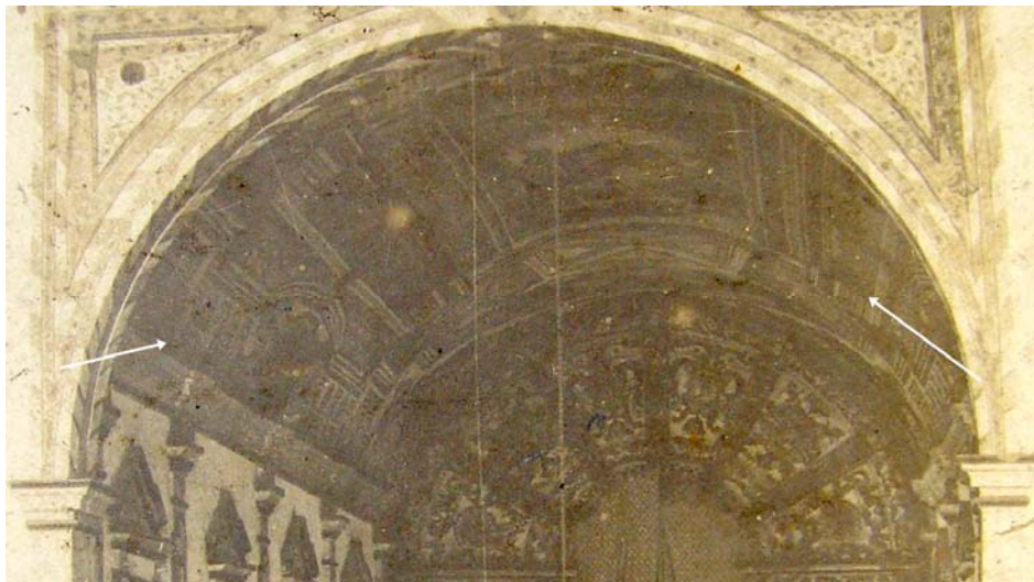
Fig.6 1908 - Detalhe - Forro da capela-mor 47

Apesar da falta de nitidez a ampliação mostra que existia uma pintura anterior a atual, percebe-se que a imagem acompanha a cúpula do forro e está repleta de elementos ornamentais, dando ao conjunto uma unidade harmoniosa e plena. Inclusive com o retábulo dourado do século XVII ao fundo do espaço, que traz sobriedade, imponência e riqueza características tão bem conquistadas pelos trabalhos realizados pelos jesuítas. Não foram encontrados nesta pesquisa relatos que descrevam em detalhes como ocorria o funcionamento da produção artística no interior das oficinas do Colégio da Luz, especialmente no que se refere à pintura.