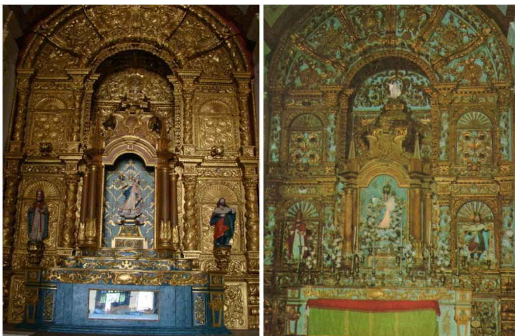
Fig. 8 Retábulo em 2015 após sucessivos processos de restauro.

O laudo posterior de 1993/94, aponta que, provavelmente, a tonalidade azul deve ter sido colocada quando a inserção dos elementos rococós em data posterior, e "o douramento encontrado sob o azul o retorna às condições cromáticas condizentes com o estilo do entalhe, permitindo a segurança ao datar o retábulo como obra da segunda metade do século XVII". Assim, justificou-se a remoção da tinta azul no restauro.