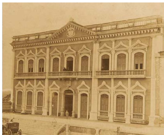
Fig. 3 Palácio Episcopal – 1908 Fotografia de Gaudêncio Cunha 39

O mesmo não ocorreu com o Palácio Episcopal. Na litografia a fachada encontra-se de acordo com o estilo colonial da igreja, no entanto a fotografia de Gaudêncio relata a descaracterização arquitetônica com ornamentação neoclássica, distanciando radicalmente da característica colonial do templo.