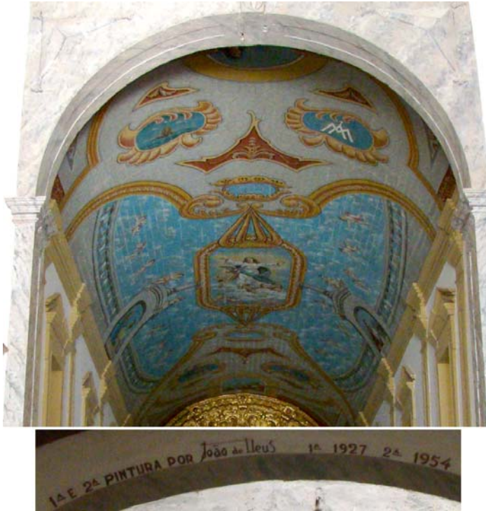
Fig. 7 Interior da igreja.

Detalhe do forro da capela-mor com pintura de João de Deus.