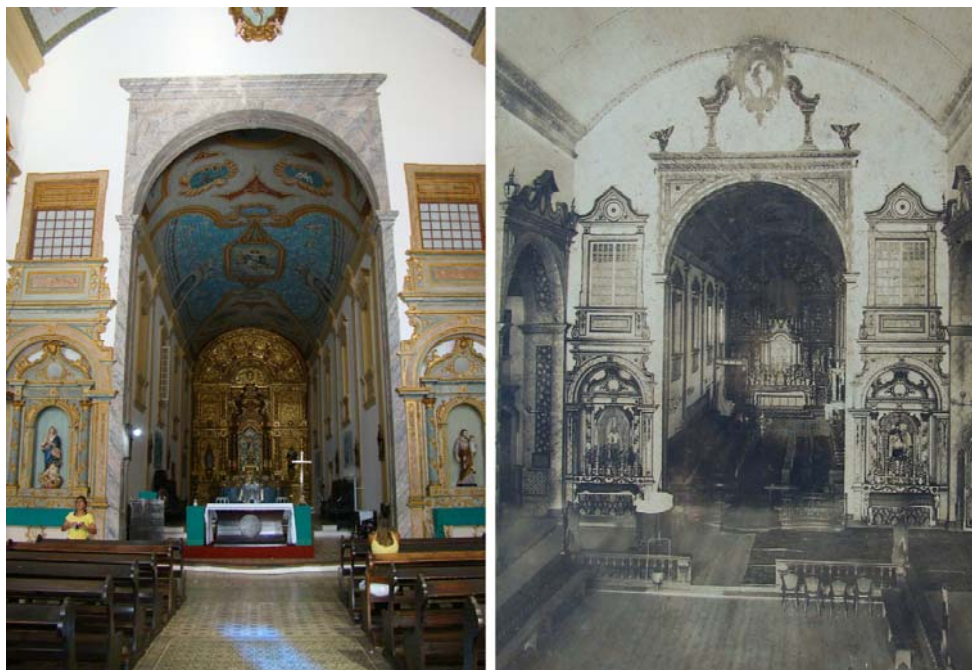
Fig. 5 Interior da Catedral da Sé Foto das autoras - 2015

A intervenção não se limitou apenas externamente propagou-se também para o interior do templo (Fig.5). Observou-se diversas modificações internas em muitos elementos decorativos, porém, o recorte deste trabalho se ateve ao retábulo e ao forro da capela-mor.