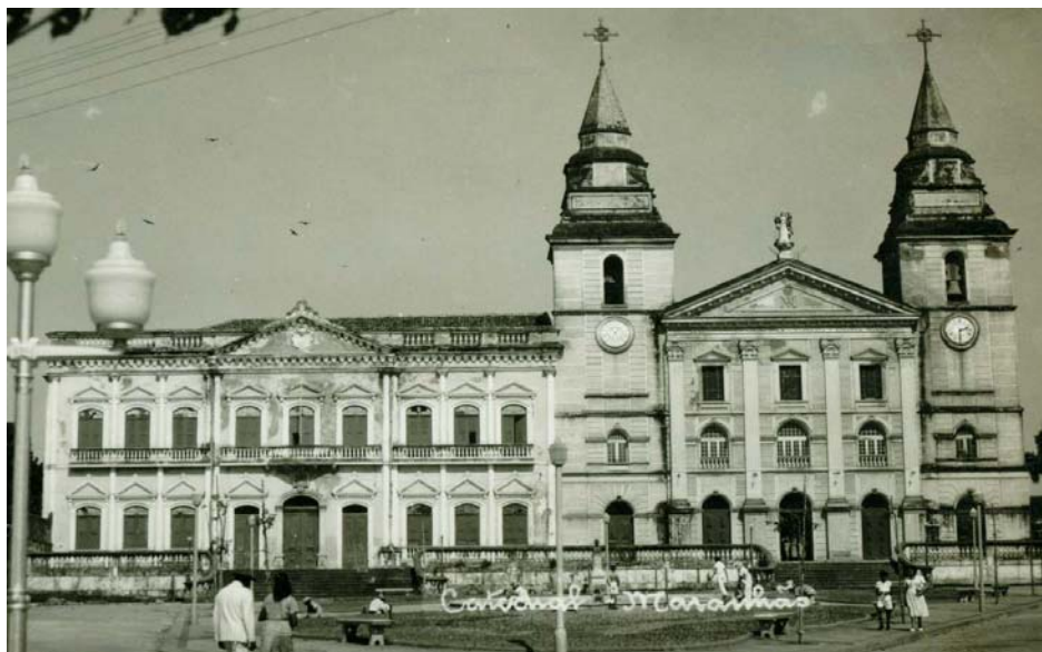
Fig. 4 Vista da Catedral da Sé e Palácio Episcopal. Início do séc.XX. Fonte: Biblioteca Digital do IBGE, s.d. 40

Nesta imagem (Fig. 4) observa-se: a catedral com duas torres, frontão completamente modificado, desaparecimento do óculo, inserção de vitrais e a “modernização” de estilo, do colonial para o neoclássico; uma total distorção do que era o templo original erguido pelos jesuítas.