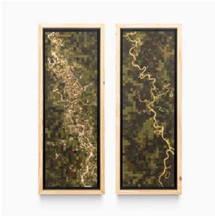
Imagen 2: Miguel Ángel Rojas “Atrato Herido” 2022. Colección Museum of Modern Art (MoMA)|Art Institute of Chicago. Recuperado de: https://www.artsy.net/artwork/miguel-angel-rojas-atrato-herido

La obra “Atrato herido” (2022) (Imagen 2) es un díptico en la que podemos encontrar un tratamiento artístico similar al “El nuevo Dorado”, pero trata sobre 7 ,