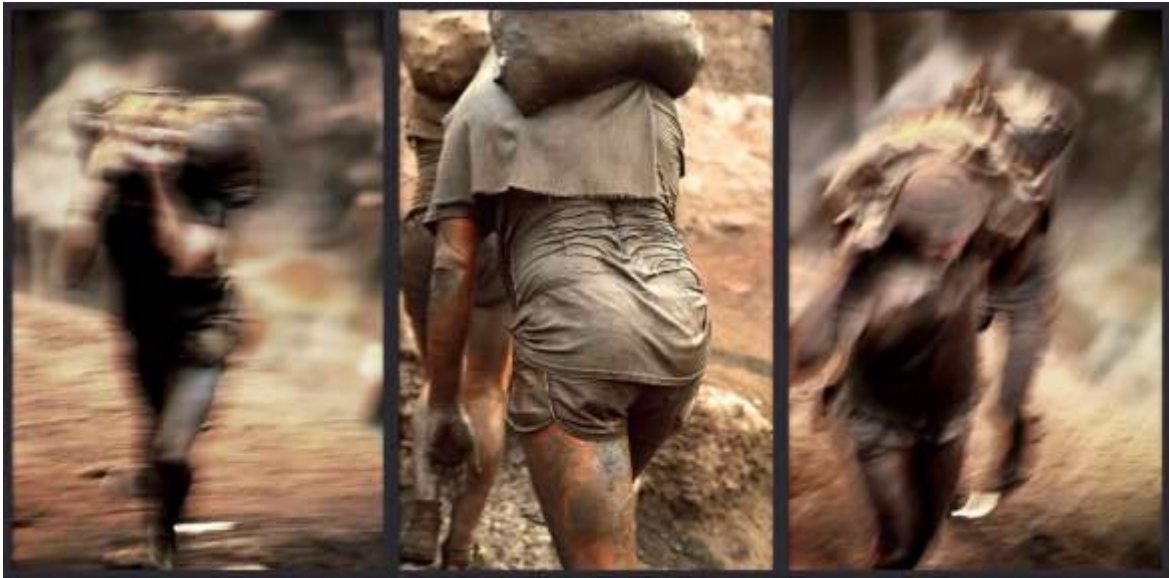
Imagen 6: Alfred Jaar. "Oro en la mañana" (1985) Fotografía.

"Oro en la mañana" (Imagen 6) es una magna pieza del chileno Alfred Jaar realizada a partir de una serie fotográfica tomada en la mina de oro a cielo abierto en Brasil, Serra Pelada. Allí desarrolló una práctica de investigación in situ que es característica de muchos de sus trabajos precedentes y posteriores. Su resultado adquirió carácter transnacional pues significó una intervención pública en la estación de metro neoyorquina de Spring Street titulada "Rushes" [Crudos] (1986) (Imagen 7) y una instalación Gold in the Morning [Oro en la mañana] (1986), exhibida en la Bienal de Venecia.