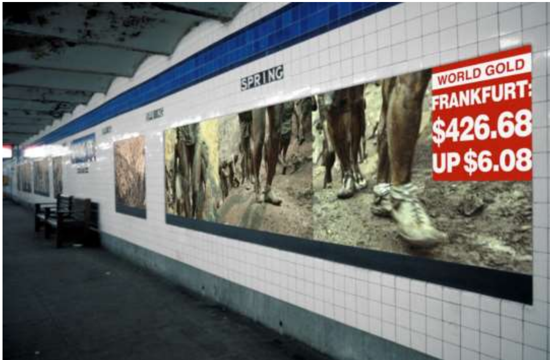
Imagen 7: Alfred Jaar. "Rushes" (1986) Recuperado de: https://alfredojaar.net/projects/1986/rushes/

El valor testimonial de las imágenes destaca las condiciones de trabajo infrahumanas en el espacio de la mina, es una visión apocalíptica donde parecería imposible imaginar la tarea diaria a la que se encuentran sometidos en la localización y búsqueda del oro, lo que nos remite a pensar en las que vivieron tantos y tantos otros en condiciones similares y aún peores durante toda esa furia áurea de los siglos de búsqueda del El Dorado. Instalada en el metro neoyorkino, las fotografías se hicieron parte de una empresa colonial en tiempos de transnacionales y de globalización al estar acompañadas de cifras del valor del oro en las distintas bolsas más importantes del mundo: Londres, Frankfurt, Zurich y claro en el propio Nueva York. El contraste entre el cómo se obtenía cada onza de oro y las referencias a sus precios internacionales era una verdadera gesta de denuncia en solo una de las tantas minas en el espacio latinoamericano.