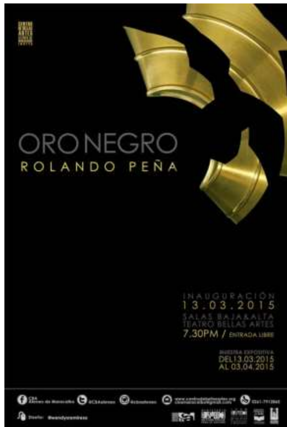
Imagen 4: Rolando Peña. “Oro Negro” (2015) Carátula de catálogo. Exposición. Recuperado de: https://correocultural.com/2015/03/exposicion-oro-negro-del-destacado-artista-plastico-venezolano-rolando-pena

Como artista, estoy comprometido a crear conciencia, denunciando los desastres ecológicos causados por el mal uso del petróleo. Espero afectar el pensamiento de la gente en este tema crítico... Heroísmo es entender los eventos del día a día y convertirlos en arte (Peña, 2015, Párr. 3).