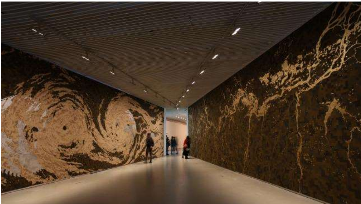
Imagen 3: Miguel Ángel Rojas. “El Nuevo Dorado” (2019). Recuperado de: https://www.eltiempo.com/cultura/arte-y-teatro/miguel-angel-rojas-confronta-la-destruccion-del-amazonas-en-el-mambo-579847

“El Nuevo Dorado” (Imagen 3) es como lo expresó Glusberg, una metáfora de metáforas. En ella el Amazonas, recorrido en toda su extensión por Orellana, es el gran protagonista como una gran serpiente dorada que atraviesa un paisaje realizado con hojas de coca en sus más diversos matices, donde “estas tierras, robadas a la selva, se están dedicando a monocultivos como el de la hoja de coca y a la minería en superficie, lo que destruye por completo la naturaleza y convierte los ríos en torrentes de lodo” (Rojas, 2021, párr. 4), explica el artista. Así revela la conjunción de dos alternativas, en las que -precisa- “no encuentro ninguna diferencia entre el saqueo y la expropiación que empezó hace cinco siglos con la conquista europea en América” (Rojas, 2021, Párr. 5), con los extractivismos transnacionales y el narcotráfico generado a partir del procesamiento de esa hoja sagrada, para revelarnos en la misma belleza de la pieza su propia contradicción que parece remitirnos a la obra emblemática de Eduardo Galeano, Las venas abiertas de América Latina .