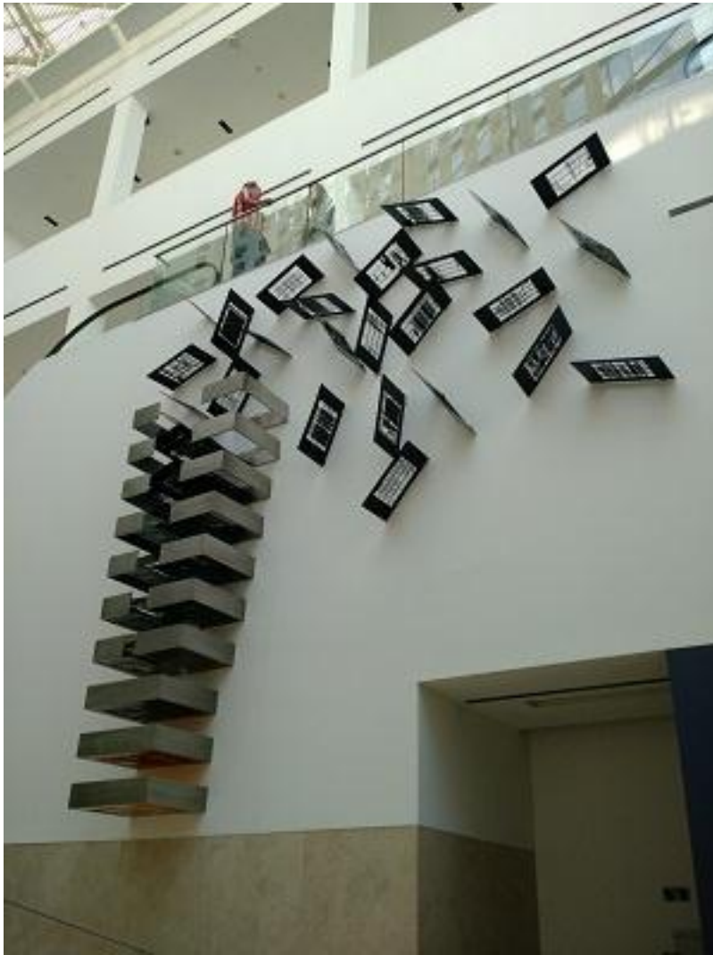
Figura 1: En nuestra pequeña región de por acá (MALBA, 2016)

A pesar de que utiliza archivos y articula múltiples referencias, las doce piezas que forman la exhibición de Jarpa (que incluye pinturas, objetos, instalaciones, video multicanal y documentos) no arrojan luz (o no exclusivamente) sobre la actuación de Estados Unidos durante las dictaduras latinoamericanas, ni tematizan de modo explícito el horror de la tortura y la desaparición que siguieron a los procesos de dominación total, ni esclarecen las operaciones del Plan Cóndor, sino que, podría decirse, proponen dos desafíos alejados de estas sugerencias historiográficas que son los que pretenden explorar las páginas que siguen. Por un lado, transforma en “objeto” artístico –podría decirse que se trata de un site specific IV - el sustrato fundamental de la ordenación