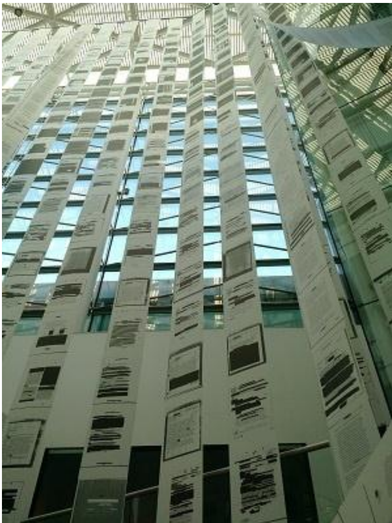
Figura 2: En nuestra pequeña región de por acá (MALBA, 2016)

espacio temporal -con fechas, firmas, datos, tachaduras de la censura, marcas gráficas de todo tipo, sellos y fórmulas oficiales-, un volumen de tiempo con una localización que subvierte la típica forma de archivo. Los documentos no están dispuestos horizontalmente para ser leídos, sino ubicados de forma vertical para ser vistos solo escorzadamente. No están ahí para ser investigados, sino para ser atravesados como localización, observados como volumen espacial, habitados en temporalidad problemática. El texto y la imagen se funden en un todo complejo: el primero es apenas legible mientras la segunda es imposible de procesar en su totalidad (ver Fig. 2).