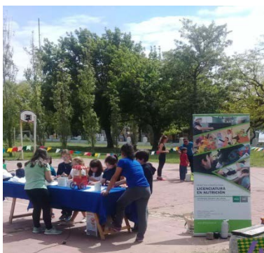
Imagen N° 1: Jornada Familiar “Niño activo, adulto saludable”

Junto a sus familias mostraron entusiasmo, y curiosidad sobre todo en las postas donde se realizaban las preparaciones y colaciones saludables, en las que podían participar en la elaboración directa, como lo muestra la Imagen N° 1.