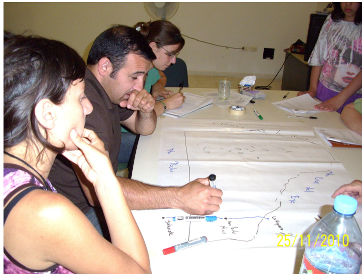
Figura 2. Integrantes del PAP con participantes del taller “Lo tuyo, lo mío, lo nuestro: Reflexiones sobre Derechos Culturales del Patrimonio Arqueológico”.

En un segundo momento, se abrió el espacio al debate a través de la aplicación de técnicas de Cartografía Social. En un afiche en blanco, los participantes comenzaron a reflexionar sobre San Carlos Minas y sus alrededores, construyendo un mapa donde fueron ubicando los bienes que consideraban patrimonio del lugar. Si bien la metodología de trabajo de la Cartografía Social contempla la puesta en común y el debate acerca de los diferentes mapas confeccionados, como uno de los momentos más enriquecedores y estimulantes del encuentro, en este caso solamente se discutió lo plasmado en un único mapa, dado el reducido número de participantes (Figura 2).