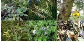
Fig. 7: Especies medicinales de uso tradicional con respaldo científico. Las más utilizadas en el área de estudio (de izq. a der. de arriba hacia abajo) son: “Peperina” Minthostachys verticillata (Griseb.) Epling; “Palo amarillo” Aloysia gratissima (Gillies & Hook. ex Hook.) Tronc. var; gratissima ; “Chañar” Geoffroea decorticans (Gillies ex Hook. & Arn.) Burkart; “Palán-palán” Nicotiana glauca Graham; “Menta” Mentha spp.; “Eucalipto” Eucalyptus spp.