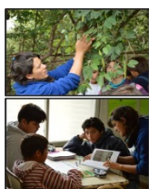
Fig. 2: Reconocimiento e identificación de especies medicinales locales, mediante recorridas a campo, bibliografía especializada y recuperación de saberes locales