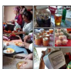
Fig. 5: Talleres de prácticas apropiadas de recolección y procesamiento de productos alimenticios y medicinales.