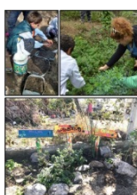
Fig. 6: Talleres de prácticas de reproducción de especies nativas, montaje de cartelería acorde a especies medicinales de uso tradicional/científico, Actividad de Taller escolar.