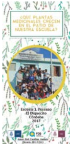
Fig. 8: Portada del tríptico diseñado en la escuela J. Peyrano de El Diquecito, que recopila información etnomédica local de las 11 especies de uso más frecuente en el entorno escolar, 7 de ellas nativas y 4 cultivadas (Diseño: Alma Prosdocimo)