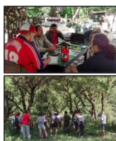
Fig. 3: Actividad de capacitación en senderismo, diseño y guía en ecoturismo. Fig. 4: Práctica de guía en el sendero "La Cascada del Indio Bamba".