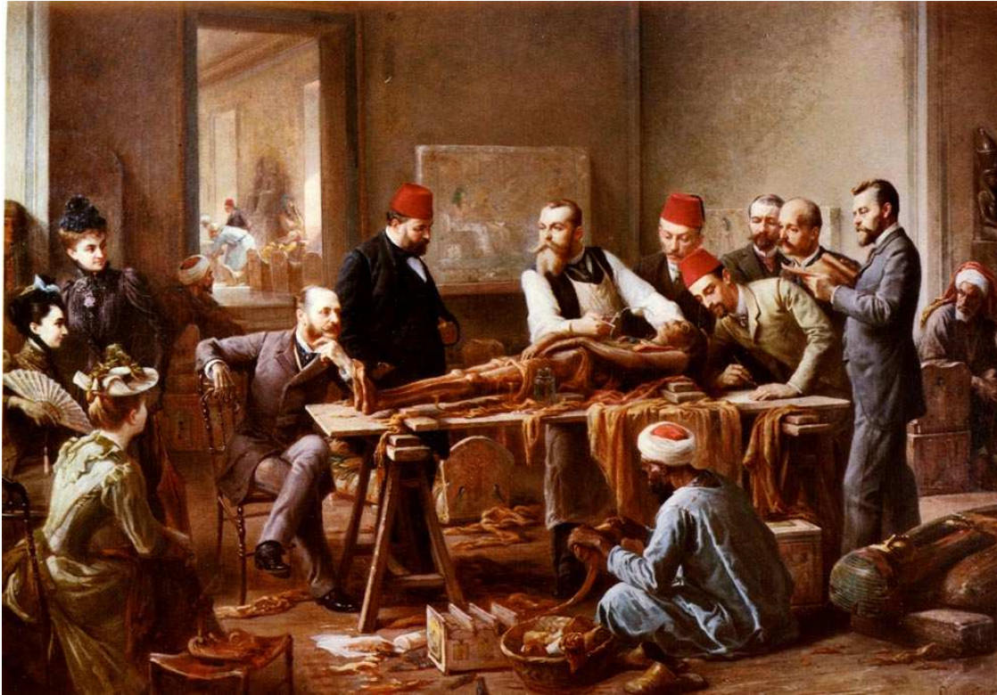
FIGURA 2. Paul-Dominique Philippoteaux. Examen d'une momie. Une prêtresse d'Ammon . 1891. (Tomada de http://www.leicestergalleries.com ).

La idea de que los egipcios no se interesaban por el propio pasado fue quizás la mayor violencia epistémica del colonialismo científico por parte de europeos y norteamericanos. La retórica del desinterés árabe sobre su propio pasado tuvo resultados nefastos. En primer lugar, dio sustento al discurso que investía a los europeos -especialmente franceses, ingleses, alemanes e italianos- y estadounidenses del privilegio de estudiar y proteger las materialidades faraónicas. Protegerlas incluso de los propios egipcios, percibidos como salvajes y ladrones de tumbas. Reforzando el lugar de europeos y americanos como verdaderos guardianes del pasado faraónico, existe la afirmación de que Egipto fue la cuna de la civilización. La familiaridad de los europeos con Egipto a través de la Biblia, de las exposiciones y ferias, de los textos de los viajeros y del turismo creciente daba peso a esta postura. En segundo lugar, habilitó un discurso que disocia a lo islámico del pasado egipcio, como si la historia egipcia fuese resultado solo del pasado faraónico. La propia egiptología hace referencia sólo al estudio del pasado faraónico, dejando de lado toda la historia del Egipto Islámico. No deja de llamar la atención el escasísimo espacio dedicado en los museos arqueológicos a lo