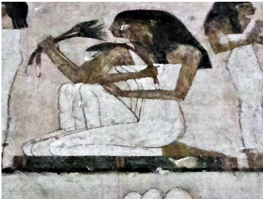
FIGURA 9. TT 100. Tumba de Rekhmire, necrópolis tebana (Ph. Autores).

El mundo del Egipto faraónico transcurre a las orillas del Nilo con su eterno ciclo de Este a Oeste recorrido por diferentes seres (que catalogaríamos como dioses, humanos, animales, plantas y el sol). Al orientar la lectura hacia las plantas, llama la atención la diversidad de flores heliótropas que pueblan ese registro. Heliótropas son las flores que siguen al sol abriéndose de día y cerrándose de noche: nenúfares, amapolas, diversas centáureas, entre otras. Previamente uno de nosotros ha discutido largamente la naturalización y universalización de la clasificación de Linneo en el campo de la arqueología (Marconetto: 2007); paradójicamente el reloj floral que el mismo Linneo diseñó y plantó en Uppsala resonó en la idea de pensar el vínculo entre las flores y el tiempo. Así como la taxonomía que usamos en la clasificación de nuestros restos botánicos en arqueología es moderna, también lo es nuestra idea de tiempo lineal. El Egipto faraónico parece desestructurar a la vez esos dos elementos: un tiempo cíclico, no lineal, marcado por seres -flores- que acompañan (¿o engendran? Como en el caso del loto azul) al sol. La tríada loto cerrado-abierto-cerrado, se repite ad infinitum en diversas escenas junto a hombres, mujeres, dioses, toros. Noche-día-noche, parece repetir mientras anima las escenas en un tiempo circular y solar. Este es un punto singular a continuar explorando, dada su potencia para horadar el sueño de universalidad del modo moderno de estar en el mundo.