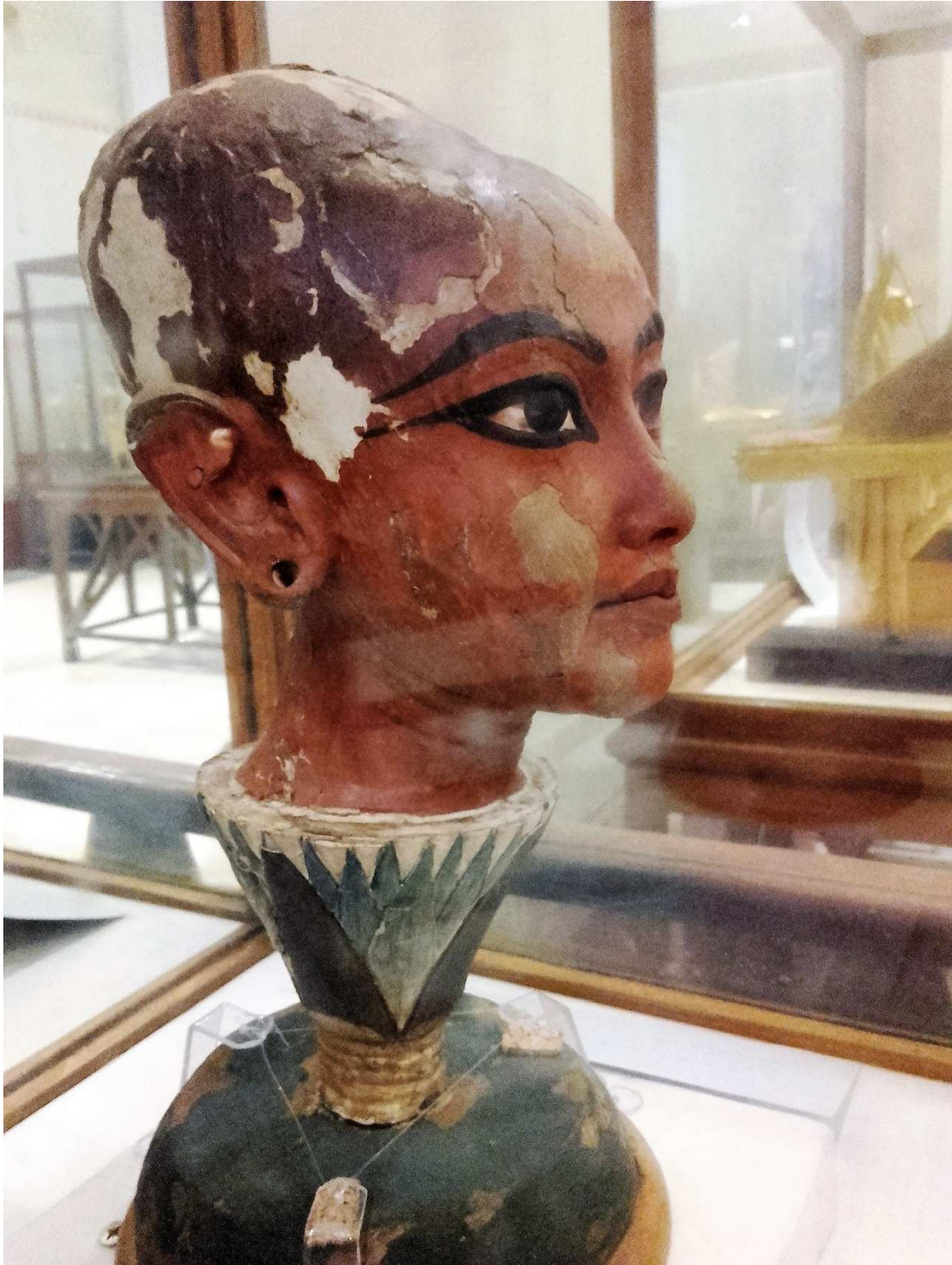
FIGURA 4. Faraón Tutankamón surgiendo de flor de loto. Recuperada en KV 62. Actualmente Museo del Cairo.