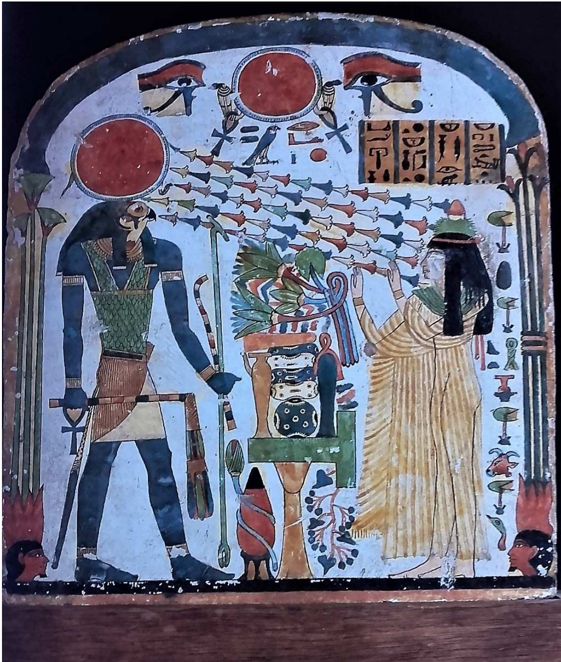
FIGURA 1. Tomada de Étienne, M. (2009). Les portes du ciel. Visions du monde dans l’Égypte ancienne . Paris: Somogy Éditions d’Art, Musée du Louvre.

Los rayos florales de Ra acababan de intersectar nuestras investigaciones y reflexiones. Creemos no equivocarnos si tomamos ese momento como la simiente del proyecto conjunto que sumaría a la Universidad Nacional de Córdoba en la siguiente misión del Brazilian Archaeological Program in Egypt , llevada adelante entre diciembre de 2017 y enero de 2018. Así, entre caipirinhas y fernet, nos proponemos esta reflexión acerca de por qué el Sur en el Egipto faraónico y cómo