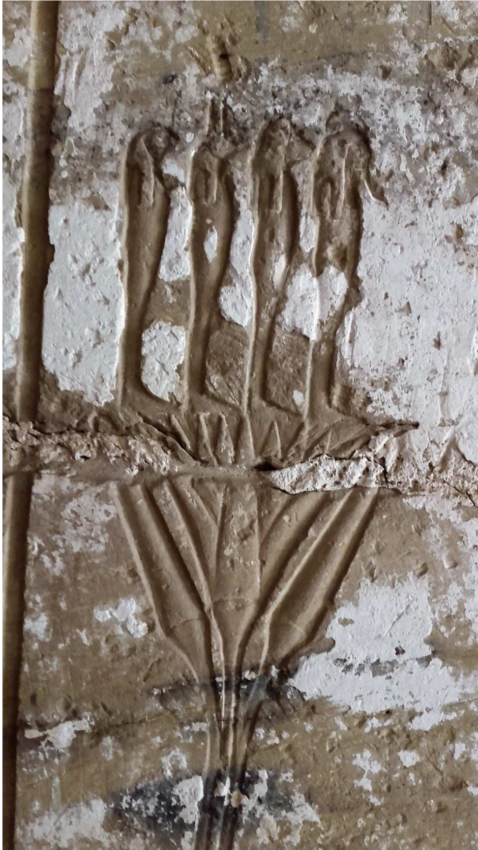
FIGURA 3. Divinidades surgiendo de flor de loto. Templo Medinet Habu.