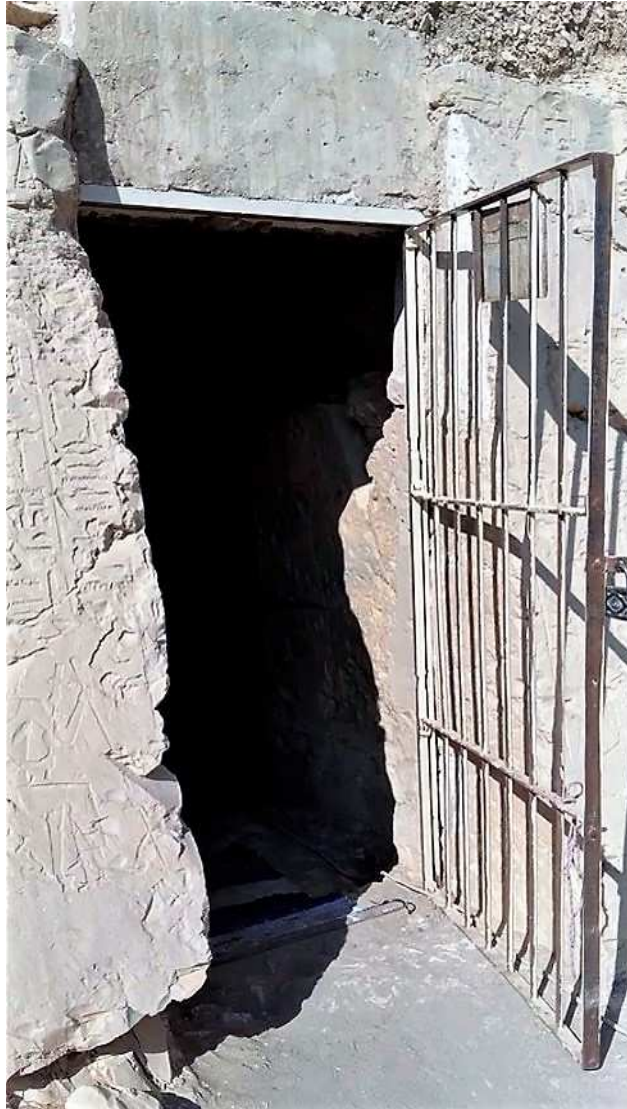
FIGURA 7. Necrópolis, sector Sheik abd el Qurna, ingreso a la Tumba Tebana 123.

Los trabajos de campo arqueológicos se realizan en la necrópolis tebana, en el llamado valle de los Nobles, en el sector Sheik abd el Qurna, tumbas TT 123 y TT 368. Puntualmente en la tumba TT 123, donde se aloja Amenemhat casado con Henutiri. Según indican los jeroglíficos a la entrada, fue un escriba, supervisor de graneros y contador de panes durante el reinado de Tutmosis III, quien gobernó Egipto entre c. 1479 a 1425 a. C.