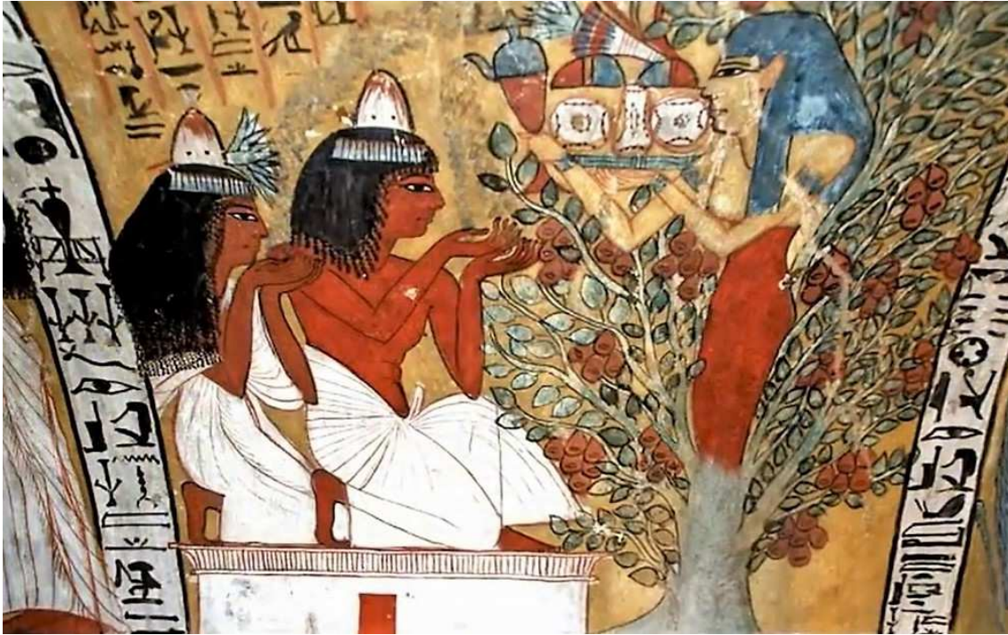
FIGURA 5. Diosa Isis/árbol Sicomoro. Tumba de Senneidjem – Deir el Medina. (Ph. Autores).