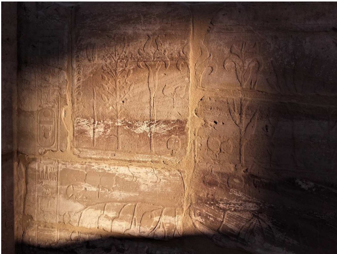
FIGURA 8. Ejemplos de grabados del “jardín Botánico”, Templo de Karnak, Lúxor.

de vegetación. Resulta sugestivo que durante el reinado de Tutmosis III, este visir mandó a construir en el templo de Karnak el sector conocido como “el jardín botánico”, en cuyos muros se encuentra grabada una amplia variedad de aves y de plantas que crecen fuera de Egipto, así como ejemplares que presentan algún tipo de anomalía en su crecimiento (Beaux, 1990). El interés por estos seres intersecta nuestros propios intereses y nos habilita a reflexionar sobre relaciones otras que desarticulen la concepción de una naturaleza disociada de la cultura, pilar de la modernidad y consecuentemente del colonialismo.