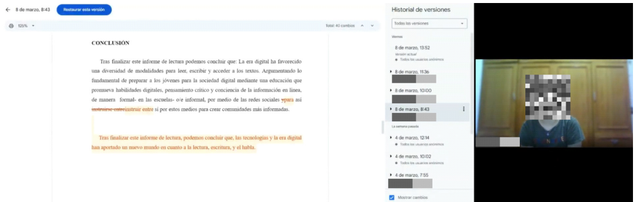
Figura 3. Captura de pantalla de entrevista en línea.