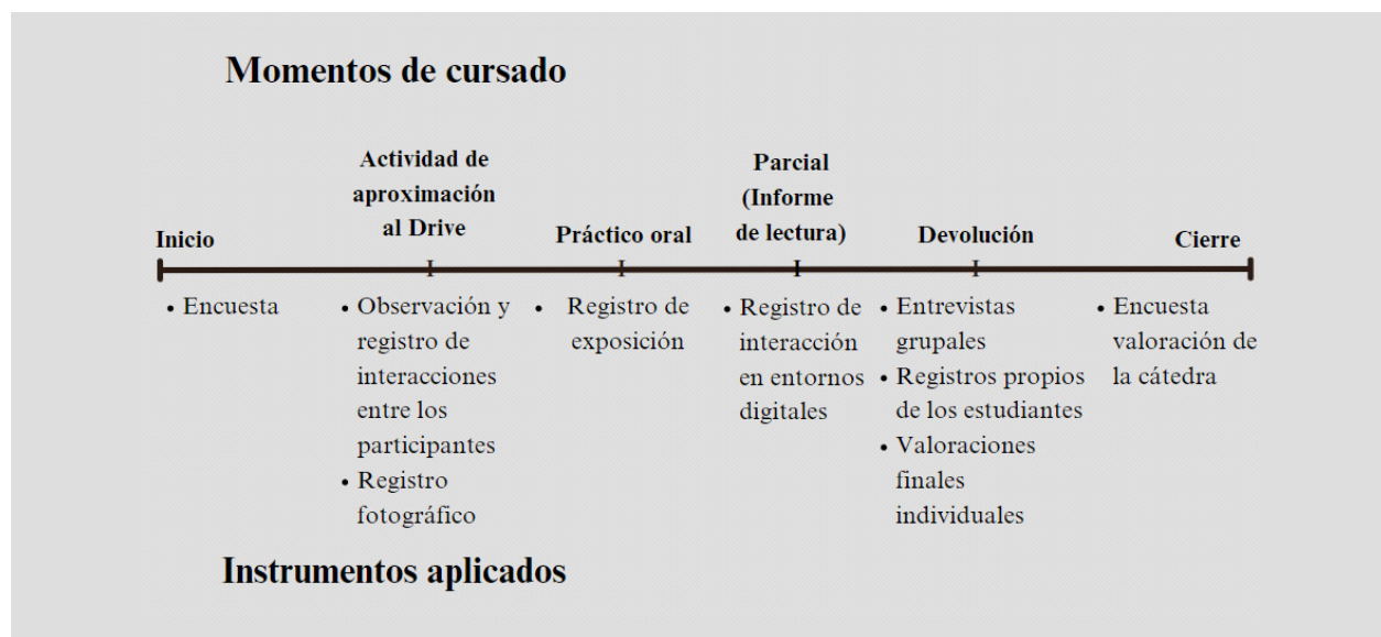
Figura 1. Línea metodológica.

datos se iban a complementar con otros instrumentos utilizados durante y a posteriori del cursado.