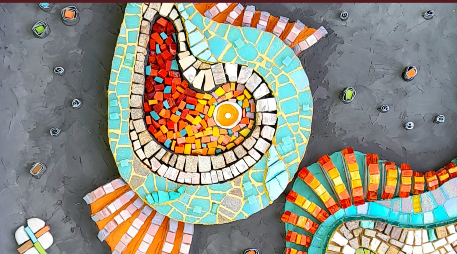
Gestación (2019) · Cecilia Rodríguez · Mosaico