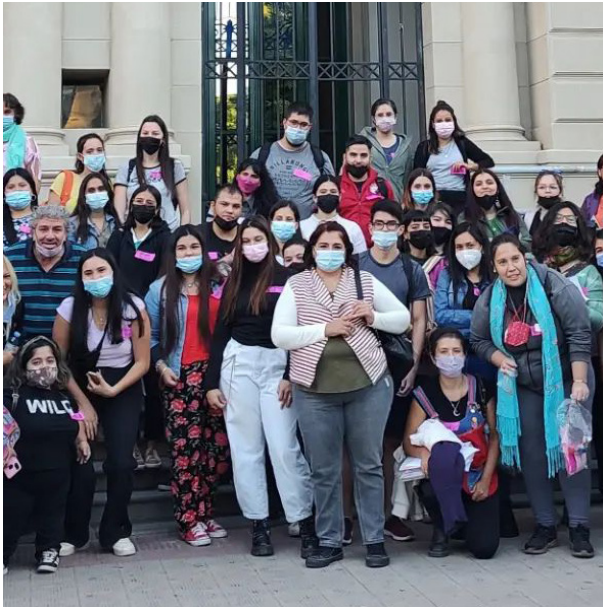
Estudiantes y docentes en el ingreso a la Escuela Normal A. Carbó.

“El itinerario propuesto por docentes y estudiantes de la Escuela Carbó posibilitó conocer las actas fundacionales, entre ellas, el decreto de creación firmado por el presidente Julio Argentino Roca, el título original de maestra de Francisca Armstrong, quien se desempeñó como docente entre 1884 y 1888, y los primeros analíticos expedidos.”