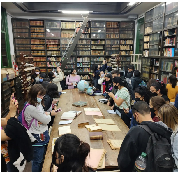
Estudiantes y docentes en la biblioteca de la Escuela Normal Alejandro Carbó.

que fue atravesando su historia institucional. Y allí estábamos, sin darnos cuenta, produciendo una articulación en la formación docente de nivel superior inédita en estos tiempos que tendría repercusiones en la siguiente visita programada. Una experiencia que, en palabras de un estudiante, le permitió “hacer de la historia algo vivo, cercano, que dialoga con el presente, que nos permite saber de dónde venimos y preguntarnos hacia dónde vamos”.