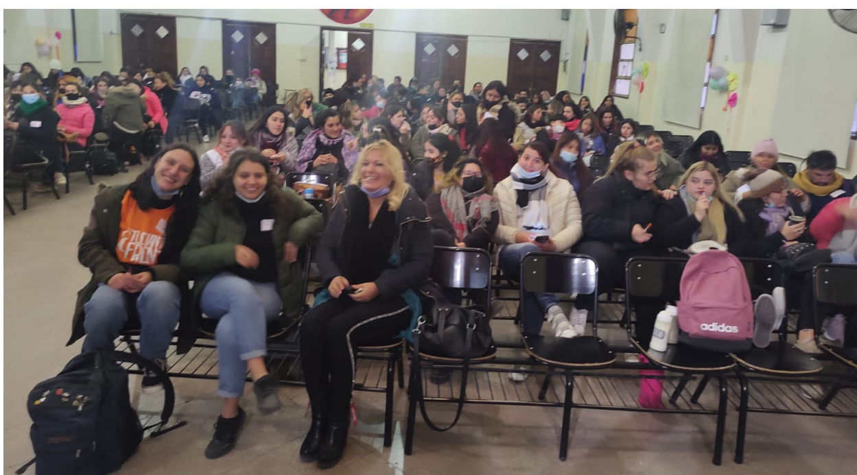
Estudiantes y docentes en el auditorio de la Escuela Normal Superior Agustín Garzón Agulla.