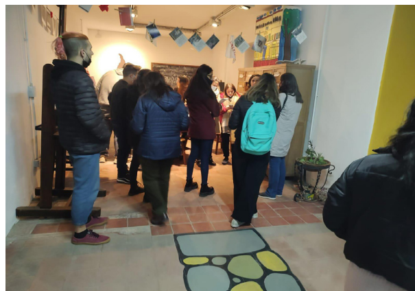
Estudiantes y docentes en el Museo Pedagógico de la Escuela Normal Superior Agustín Garzón Agulla.

“...fueron fluyendo referencias a lecturas producidas en diferentes espacios curriculares, como si muchos planteos abordados de modo diferenciado comenzaran a articularse por el efecto de entrar en contacto con la materialidad de las experiencias pedagógicas de la ENSAC y la ENSAGA.”