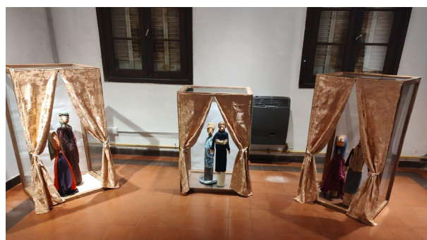
Producciones que integran el Museo Pedagógico de la Escuela Normal Superior Agustín Garzón Agulla.