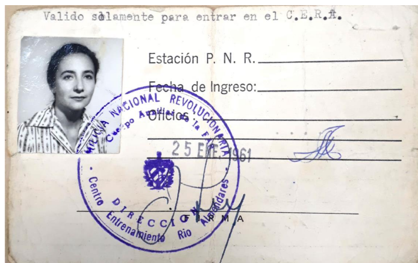
Documento personal de la Colección en la Biblioteca Nacional Argentina