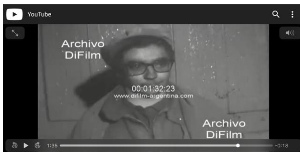
Detienen a guerrilleros en la localidad de Taco Ralo - Tucuman 1968