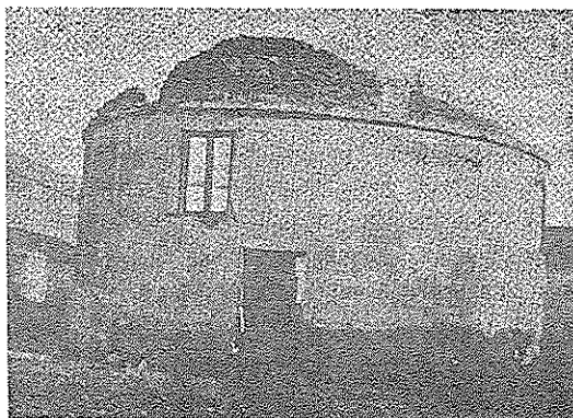
Fotografía publicada por el P. Grenón en 1927 de las ruinas del Refñidero de Gallos ubicadas en la primera cuadra de la calle Ayacucho

Después de algunas demoras provocadas seguramente por la confección del plano y la transferencia del expediente a Buenos Aires, en la sesión del 25 de mayo de 1810 el Cabildo abre un oficio del gobernador intendente del día 18 en que autoriza el gasto de $ 4.500, es decir el monto presupuestado por López para la construcción del refñidero que señalamos antes.