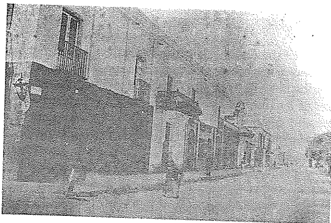
Vista de las dos propiedades construidas por Torre Palacio hacia principios del siglo XX.

Algunas observaciones particulares son que, en ambos planos, no se dibuja el piso alto del zaguán pero sí la escalera de acceso, aunque en los dos, tienen distintos arranques y desarrollos al de la actual que fue agregada con la restauración, como el piso de madera en reemplazo del enladrillado original del balcón y hasta la fecha de 1691, bien señalada como errónea por Luque Cumbres.