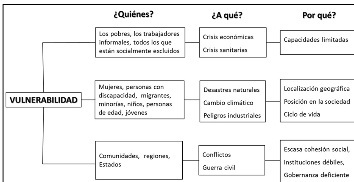
Gráfico N° 1: ¿Quiénes son vulnerables, a qué y por qué los son?