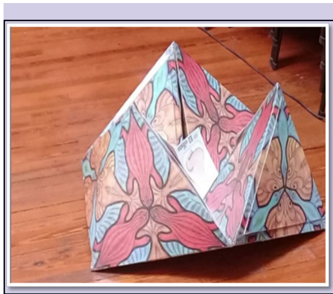
Figura 1. Dispositivo lúdico-pedagógico innovador: "Caleidociclo".

Asimismo, la poca articulación existente entre la formación disciplinar/didáctica en el área de Ciencias Naturales y las prácticas escolares en el nivel inicial, son consecuencia de una larga tradición en la formación del profesor para la enseñanza preescolar donde han estado ausentes los contenidos específicos y las propuestas didácticas para su abordaje. De esta manera es importante tender puentes entre lo que existe y lo que debiera existir (Lombardi, 1997), procesando y/o fortaleciendo las conexiones intrainstitucionales, que promuevan la reflexión sobre las propias prácticas, en relación con el uso de los recursos, actividades y otros componentes curriculares.