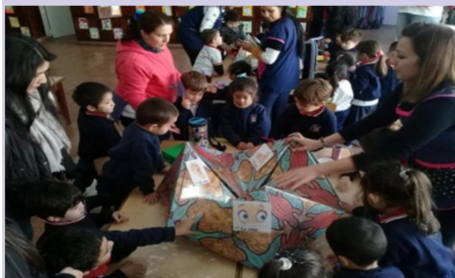
Figura 3. Desarrollo de la propuesta de articulación entre estudiantes del Nivel Inicial y los niños/as del Jardín. Escuela Normal Superior N° 2 (35) "Juan María Gutiérrez", Rosario. (Imagen propia).

como colaboradoras de este proyecto y con el personal directivo del nivel inicial de la Escuela Normal Superior N° 35. Durante las reuniones se analizaron las propuestas y se registraron las ideas de las docentes relativas a la adecuación a los grupos de niños, los resultados esperados, las características del dispositivo lúdico-pedagógico -caleidociclo- a utilizar y las posibilidades de ser llevadas a la práctica por estudiantes de 2° año de la cátedra de Ciencias Naturales y su Didáctica del Profesorado de Educación Inicial que funciona en el mismo establecimiento.