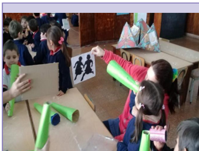
Figura 2. Puesta en marcha de la experiencia con la incorporación del Caleidociclo abordando el contenido del sentido de la vista. Escuela Normal Superior n° 2 (35) “Juan María Gutiérrez”, Rosario. (Imagen propia).

Dentro de esta propuesta, la comunicación entre el equipo directivo-docentes de cátedra y docentes de cátedra-alumnos de nivel inicial, será un pie fundamental para favorecer el abordaje del proyecto con un compromiso colectivo. Siguiendo con lo que propone Pozner consideramos a la comunicación como un instrumento de gestión estratégica en la organización, la importancia de la comunicación interna en las instituciones y su influencia sobre la toma de decisiones, la gestión curricular, el trabajo en equipo, entre otros.