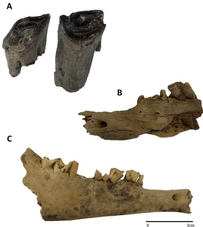
Figura 3. a) Dientes de Bos taurus recuperados en la Capa 1; b) Fragmento de mandíbula de Ovis aries recuperada en la Capa 2; c) Fragmento de mandíbula de Capra hircus recuperada en la Capa 3.

Capa 3 (asociada a estructuras de combustión-cocina: Fogón B) se han recuperado elementos esqueléticos de ovicaprinos con un índice de utilidad baja-media como metapodios, carpos, tibia y mandíbula (Figura 3).