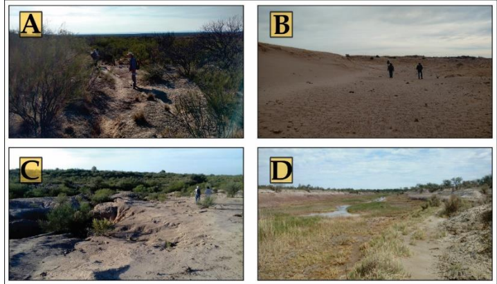
Figura 3. a) Alto de El Lechuzo; b) Médano del Bebedero 3; c) Paisaje típico de los sitios ubicados en CED; d) Arroyo Bebedero

La ubicación de los sitios en el paisaje es un dato fundamental para discutir el patrón de ocupación humana de La Travesía (Figura 3). La distribución espacial y su relación con las unidades geomorfológicas fue analizada conjuntamente con el Dr. Ojeda, quien se desempeña como geólogo en la Universidad Nacional de San Luis y en el proyecto de investigación. La totalidad de los sitios se encuentra en la provincia de Sierras Pampeanas, dentro de las regiones Depresión Longitudinal Central, Serranías Occidentales y, en menor medida, la Depresión Occidental. El análisis de mayor detalle estuvo orientado a la identificación de las unidades geomorfológicas a partir de lo cual se verificó una fuerte recurrencia de sitios en puntos bajos del paisaje. El 72 % (n= 45) están asociados a niveles de terraza o áreas de desborde asociados de arroyos pedemontanos o CED. Otro 14 % (n= 9) fue identificado en el fondo de cubetas de deflación de dunas activas. Finalmente, es una excepción notoria al patrón descrito el conjunto de canteras-taller identificados en la elevación estructural Alto de El Lechuzo que representa también un 14 % (n= 9) del total.