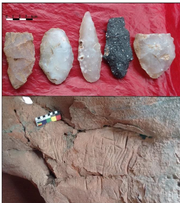
Figura 2. Puntas de Proyectoil de Puesto Jofre 2 (arriba); Arte rupestre en La Arisca (abajo)

más de 6000 m 2 . Se destacan en este registro la presencia de dos rodados muy grandes de cuarcita sin rastros de talla. LARI3 está ubicado entre las inmediaciones del puesto y represa de Doña Tita Bustos. Allí, en la porción distal de un CED se registraron 25 hornillos, obteniéndose adicionalmente un fechado con una antigüedad de 330 +/- 30 AP (Heider 2020). Por su ubicación, en el cuadro alambrado de la casa, el sitio arqueológico se encuentra alterado por los animales de corral, sin embargo, se recuperó material lítico en una superficie cercana a los 12.000 m 2 . Finalmente, LARI4 está ubicado en ambas márgenes de un pequeño arroyo seco con material disperso en una superficie muy amplia de 5.600 m 2 . Es pertinente mencionar aquí la presencia de tres agrupamientos de roca sedimentaria local cuyo origen antrópico es evidente, aunque las mismas aún no fueron estudiadas.