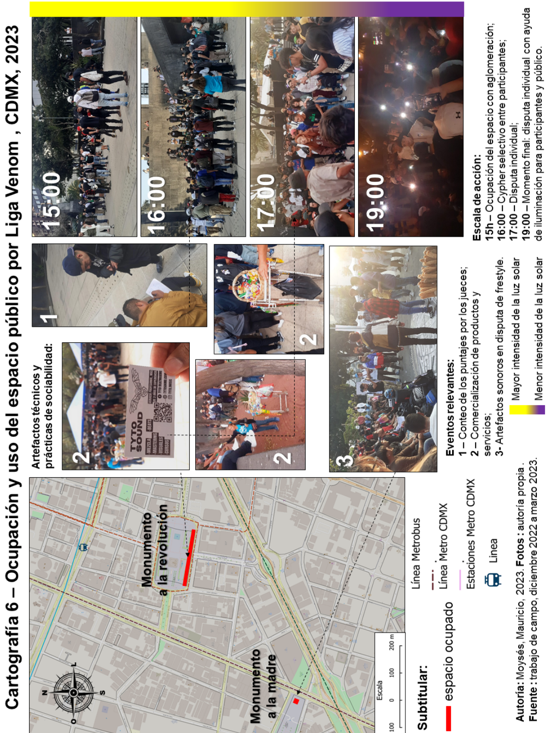
Figura N° 4 - Ocupación y uso del espacio público por Liga Venom, CDMX, 2023.

forma de arte contra competidores de otros países” (Diálogo de campo con Verso Abstracto, realizado en 15 de diciembre de 2022).