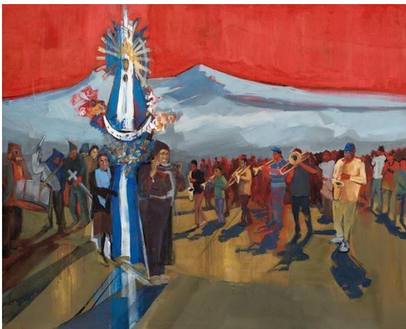
Obra N° 1: Virgen de Malvinas. Acrílico sobre tela. 2014. 150 x 180 cm.