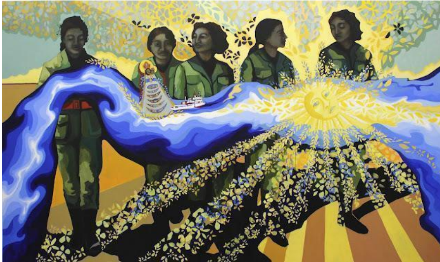
Obra N° 4: Enfermeras de Malvinas. Acrílico sobre madera. 2021. 160 x 270 cm.

La potencia geopoética llega allí donde el concepto y el instrumento que de él se desprende no llega pero que está en el paisaje, constituyéndolo como tal 7 . Así como la obra demuestra que el espacio geográfico malvinero no se reduce a su crasa fisicidad, el espacio no es una cosa, las imágenes nos revelan una bitácora existencial de nuestra comunidad que asume, plantando bandera, que Malvinas son algo más que “dos islitas”. La colección marca el pasaje de una topografía de corte tecnocrático a una topología de tipo vivencial.