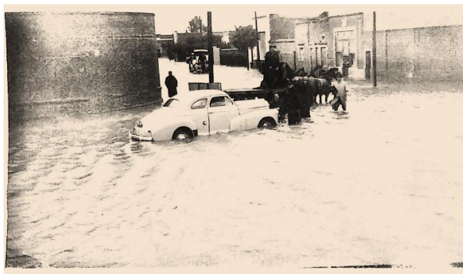
Figura N° 3. Inundación en el barrio Villa Mitre en 1944

Fecha: 6 de abril de 1944, esquina de la calle Rivadavia y Catón denominada esta última en la actualidad Agustín de Arrieta.