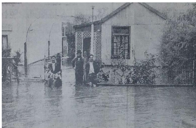
Figura N° 5. Viviendas inundadas en el barrio Villa Mitre de la ciudad de Bahía Blanca por el desborde del arroyo Napostá Grande.

Fecha: 9 de abril de 1944.