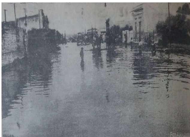
Figura N° 4. Inundación en el barrio Villa Mitre de la ciudad de Bahía Blanca por el desborde del arroyo Napostá Grande.

Fuente: fotografía extraída del Diario “El Atlántico” Fecha: 9 de abril de 1944.