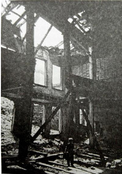
Figura N° 2 Paisaje de la amargura.

“Para comprender los orígenes de la profunda amargura que despertaba en mí el Estambul de mi infancia hay que acudir por un lado a la Historia a los resultados del desplome del imperio otomano, y por otro a la manera en que se ha reflejado en los hermosos paisajes de la ciudad y en su gente (...) es un sentimiento que se considera tanto negativo como positivo” (Pamuk, 2006:112).