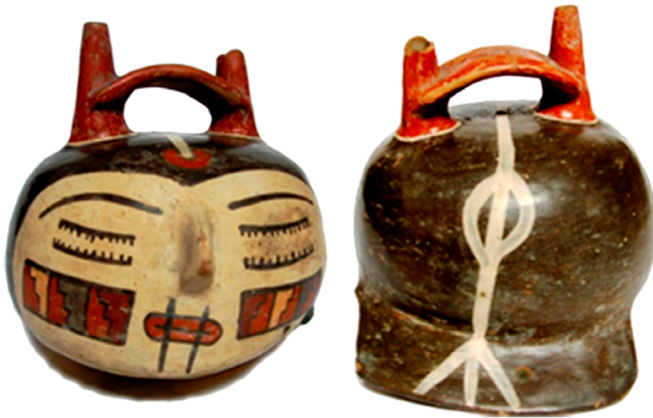
Imagen 2: MEJBA, FFyL-UBA. Alto 13,5 cm. x ancho 13 cm.

que aparecen también cabezas, en ocasiones, con plantas saliendo de sus bocas (Proulx, 2006, pp. 65-67). Con una mano, sostiene una cabeza desde el cabello a modo de asidero. Ésta es notablemente más pequeña, lo que podríamos leer en clave de perspectiva jerárquica que alude a la derrota y captura de la cabeza como trofeo y la aprehensión de su poder, así como el objeto de sacrificio que será ofrendado a las deidades. En la otra mano presenta cuchillos, lanzas o mazas, motivos que coinciden con objetos hallados en el registro arqueológico, por ejemplo, en tumbas de Cahuachi (Carmichael, 1988, p. 484) y que estarían claramente vinculados al proceso de muerte y decapitación. Si bien esto coincide con las escenas de guerreros portando cabezas y captura de prisioneros, resulta significativo que éstas sean excepcionales en comparación con las imágenes de captura y exhibición de cabezas vinculadas con deidades. Proponemos, entonces, que lo que se estaría conceptualizando es el momento de la captura a manos de una deidad que tiene como cualidad el poder sustituir productos agrícolas por cabezas cortadas o