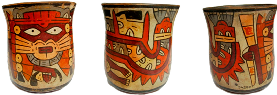
Imagen 3: MEJBA, FFyL-UBA. Alto 14,5 cm. x ancho 13 cm.

portar cabezas cortadas de cuyas bocas surgen vegetales cumpliendo con su función mediadora que permite la germinación y la continuidad de la vida (Cornejo et al., 1996).