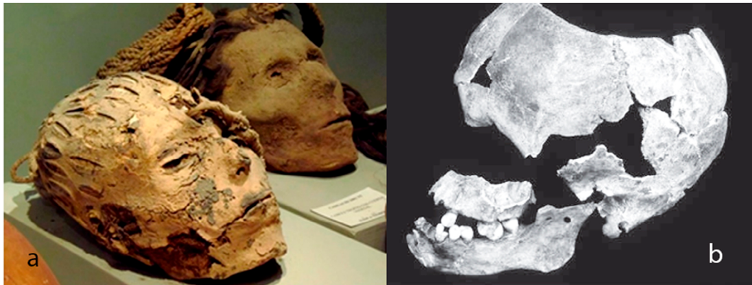
Imágenes 1.a y 1.b: Cabezas trofeo nasca procedentes de Cahuachi. Museo Antonini, Nazca. Fotografías de M. A. Bovisio; Cráneo trofeo moche procedente del conjunto arquitectónico 8 en Huacas de Moche. Tomado de Verano et al. 1999.

2) dos casos particulares de “cráneos humanos modificados”: objetos rituales elaborados a partir de cabezas frescas, presumiblemente de víctimas sacrificadas (Verano et al. , 1999) (imagen 1b), con marcas de descarnamiento y remoción de la parte superior de la bóveda craneal, hallados en un nicho de un espacio residencial sin ningún tratamiento especial en su deposición (Verano, 1998, p. 166; 2001; Verano et al. , 1999). Por ello, no coincidimos con Tello (1998) en considerarlos ejemplos de cabezas trofeo moche (p. 122), sino, más bien, como un tipo diferente de objeto ritual elaborado a partir de la cabeza, con una agencia específica propia. Verano y otros (1999) han propuesto su posible función como vasos ceremoniales, a partir de su comparación con cráneos modificados de manera similar por los incas para convertirlos en recipientes que, según mencionan las fuentes etnohistóricas, habrían funcionado como vasos rituales (p. 66). El hecho de que provengan de adultos jóvenes y la cercanía del sitio de su hallazgo con las plazas ceremoniales de la Huaca de la Luna, en las cuales habrían tenido lugar