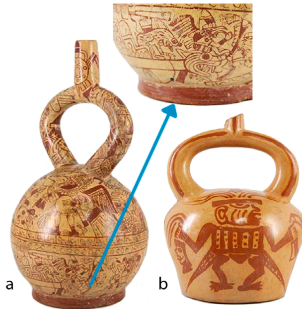
Imágenes 4.a y 4.b: Botellas gollete asa estribo pictóricas. a. Alto 28,7 cm. x ancho 15,4 cm. b. Alto 22,2 cm. x ancho 13,5 cm. Tomadas del catálogo en línea Museo Larco: https://www.museolarco.org/catalogo/index.php .

Donnan (1978) es uno de los investigadores que se ha ocupado más asiduamente de clasificar e interpretar la iconografía plasmada en la cerámica polícroma moche, asociando los diferentes motivos y escenas en conjuntos temáticos. Dentro de los temas definidos a partir de los análisis de las vasijas denominadas de “línea fina” –pertenecientes a las fases IV y V de la cerámica moche– se destaca el “Tema de la Presentación” o “Ceremonia del Sacrificio” (Alva y Donnan, 1993; Donnan, 1978) (imagen 4a), en el cual pueden aparecer las cabezas aisladas como un motivo secundario. A diferencia de lo señalado en el caso de la producción