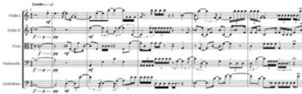
Imagen 1. Madrigale a Gesualdo , compases 7 a 12.

puede constatar que Horst mantiene e incluso profundiza la variabilidad y el alto grado de contraste textural característicos del madrigal. En esta línea, es interesante observar que en algunas secciones del Madrigale , más allá de sus niveles de correspondencia y reinterpretación, las acciones texturales resultantes presentan rasgos no reductibles a la dialéctica de tipologías que se utilizó de manera casi excluyente hasta comienzos del siglo XX (Fessel, 2005). El primero de estos formantes, y quizá el más característico en relación con esta particularidad, comienza, de manera imbricada, en el último pulso del séptimo compás con el primer violín ejecutando un mi5 sobre un bloque conformado por un si 1 , un la 3 , un do #4 y un do 5 .